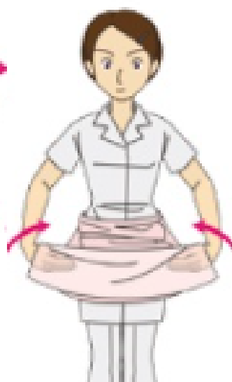
裾の内側に手を入れる