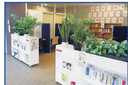
グリーンパーティション