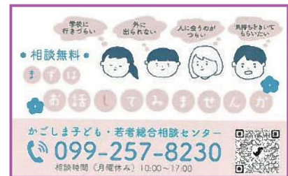
相談センターの紹介