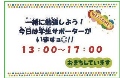
学生サポーターの案内