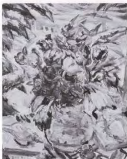
32 有馬さとえ (1893~1978) 残雪の窓 1974 油彩・キャンバス 98.5×79.0 56. 贈 美工-696