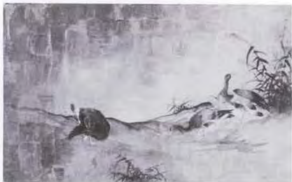
51 曾山 幸彦 (1859~1892) 雁 油彩・キャンバス 24.5×39.0 55. 購 美工-671