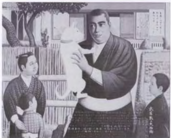
72 牧 重竹 武屋敷の大西郷 1983 油彩・キャンバス 130.0×162.0 58. 贈 美工-991