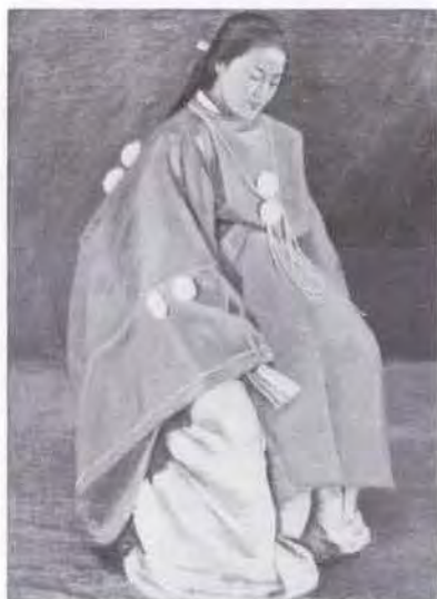
57 時任 鷗熊 (1874~1932) 女人(装束) 1901 油彩・キャンバス 61.0×46.0 51. 贈 美工-257