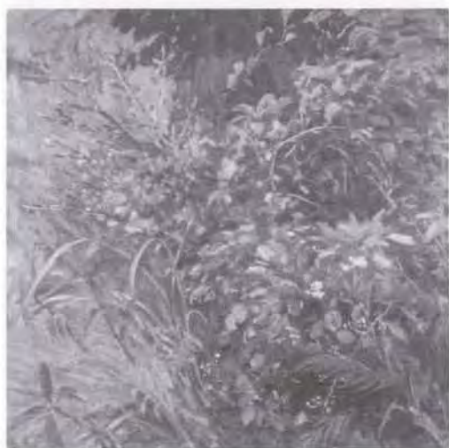
44 坂元 盛愛 (1909~ ) 秋意 1971 油彩・キャンバス 92.0×92.0 52. 贈 美工-394