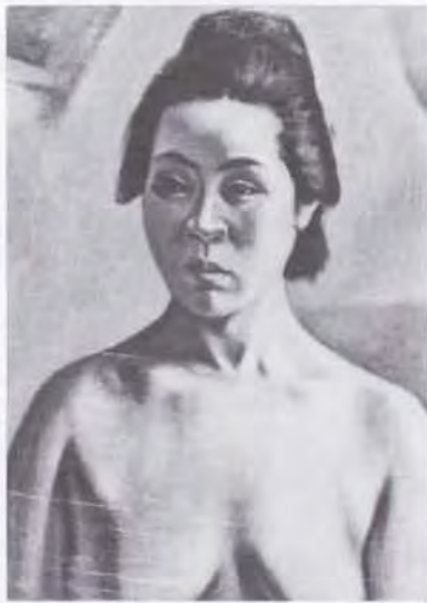
58 時任 鷗熊 (1874~1932) 裸婦 1900 油彩・キャンバス 45.5×33.0 51. 贈 美工-254