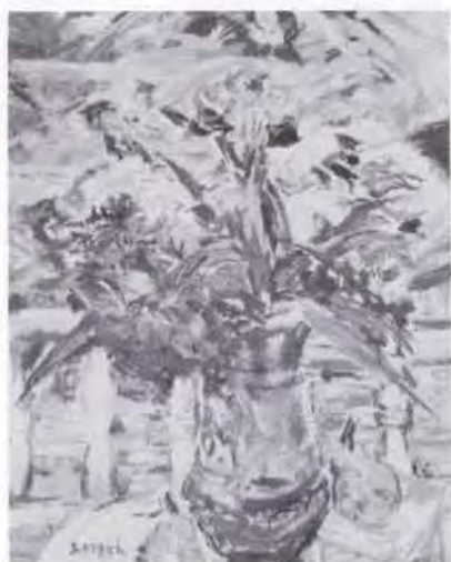
33 有馬さとえ (1893~1978) 窓の記 1976 油彩・キャンバス 99.0×79.0 56. 贈 美工-697