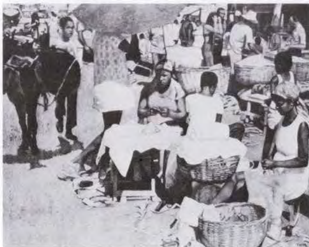
86 吉井 淳二 (1904～ ) フェイラ (サルバドール) 1975 油彩・キャンバス 182.0×227.0 50. 購 美工-225