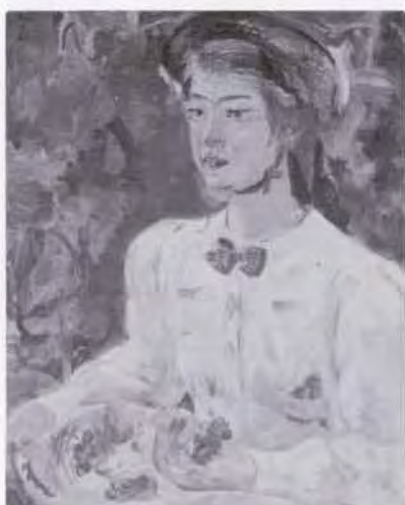
11 有馬さとえ (1893~1978) 葡萄みのる 1940 油彩・キャンバス 80.5×65.0 56. 贈 美工-677