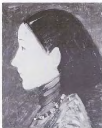
69 藤島 武二 (1867~1943) 台湾の女 1920頃 油彩・キャンバス 27.5×22.0 47. 購 美工-85