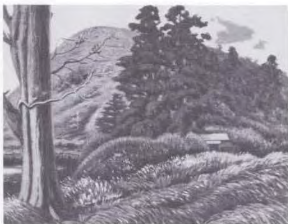
61 時任 鵬熊 (1874~1932) えびの六観音 1910 油彩・キャンバス 43.0×55.5 51. 贈 美工-260