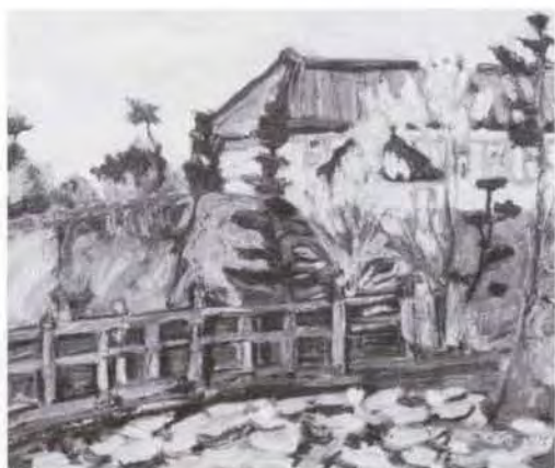
43 越山 正三 (1914~1980) 城門 1934 油彩・キャンバス 38.0×46.0 48. 贈 美工-115