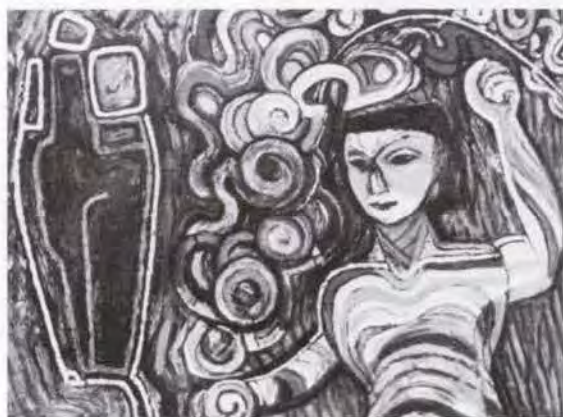
38 海老原喜之助 (1904~1970) 夏の夕べ 1964 油彩・キャンバス 96.5×130.0 47. 購 美工-88