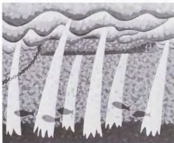
74 山内 一彦 水の中 油彩・キャンバス 81.0×100.0 47. 贈 美工-105