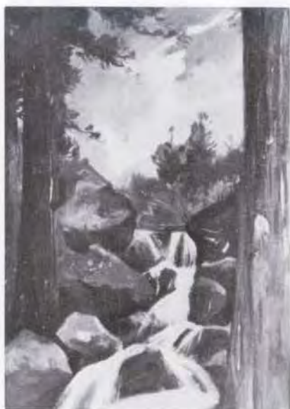
49 曾山 幸彦 (1859~1892) 滝 油彩・キャンバス 21.0×15.0 55. 購 美工-669