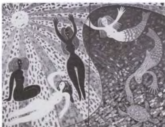
73 山内 一彦 太陽屏風(部分) 油彩・キャンバス 164.0×780.0 6枚組 47. 贈 美工-104