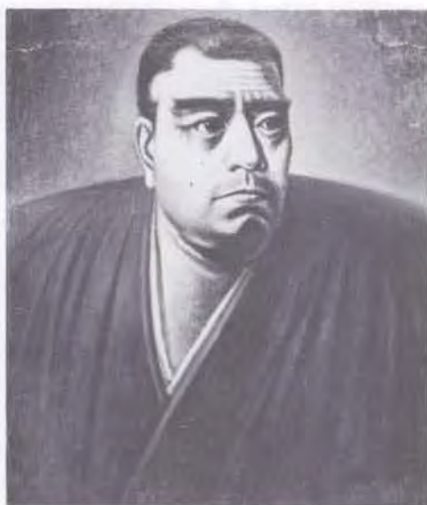
62 時任 鵬熊 (1874~1932) 西郷南洲肖像 1916頃 油彩・キャンバス 53.0×45.5 51. 贈 美工-261