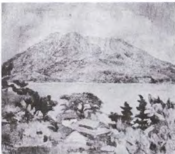
85 吉井 淳二 (1904～ ) 桜 島 油彩・キャンバス 53.0×45.5 50. 贈 美工-198