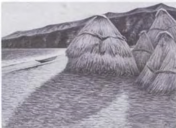
60 時任 鷗熊 (1874~1932) 入江濱 1903 油彩・キャンバス 61.5×87.5 51. 贈 美工-259