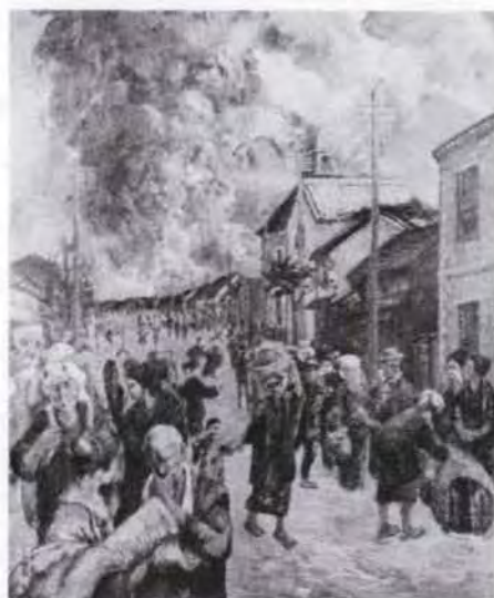
80 山下 兼秀 (1882~1939) 県庁前を避難する島民 1915 油彩・キャンバス 153.0×122.5 50. 保転 美工-213