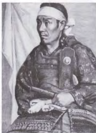
56 時任 鷗熊 (1874~1932) 武者姿 1901 油彩・キャンバス 61.0×44.0 51. 贈 美工-256