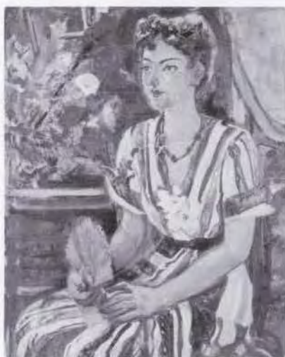
17 有馬さとえ (1893~1978) 夏の乙女 1950 油彩・キャンバス 89.5×71.5 56. 贈 美工-683