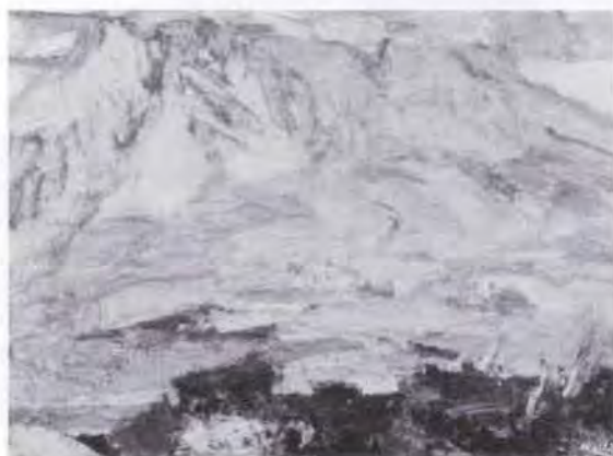
35 岩下 三四 (1907~ ) 桜島夕映え 1975 油彩・キャンバス 112.0×145.5 50. 贈 美工-221