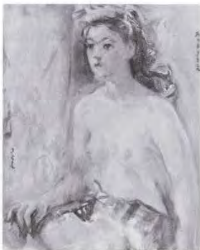
19 有馬さとえ (1893~1978) 裸婦像 1951 油彩・キャンバス 51.5×44.0 56. 贈 美工-685