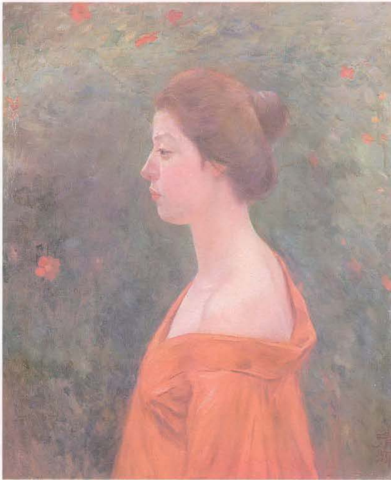
黒田 清輝筆 赤き衣を着たる女 明治45年作