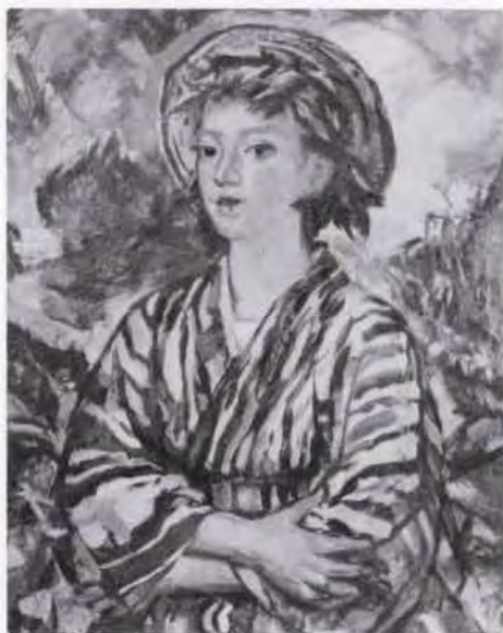
26 有馬さとえ (1893~1978) 夏草 1964 油彩・キャンバス 90.0×73.0 56. 贈 美工-691