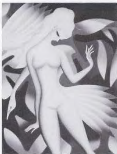
52 東郷 青児 (1897~1978) レダ 1968 油彩・キャンバス 91.0×73.0 51. 購 美工-249