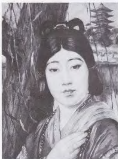
92 和田 英作 (1874~1959) 天平の女 1924 油彩・キャンバス 45.5×33.0 55. 購 美工-648