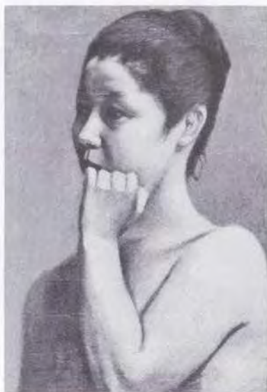
53 時任 鷗熊 (1874~1932) 裸婦 1902 油彩・キャンバス 49.5×33.5 51. 贈 美工-253