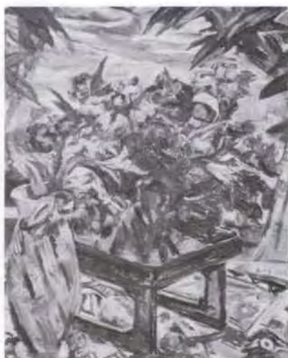
31 有馬さとえ (1893~1978) 静物 1972 油彩・キャンバス 100.0×80.5 56. 贈 美工-695