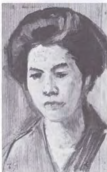
68 藤島 武二 (1867~1943) 婦人像 油彩・板 29.0×18.0 58. 贈 美工-945