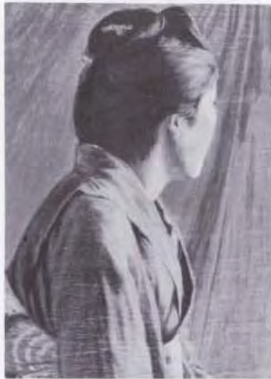
59 時任 鷗熊 (1874~1932) 娘 1902 油彩・キャンバス 50.0×33.5 51. 贈 美工-258