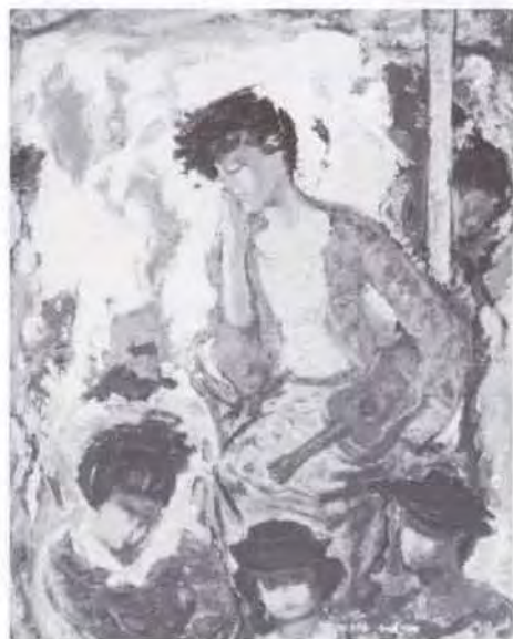
45 鮫島 梓 (1900~ ) 微風 1982 油彩・キャンバス 145.5×112.0 58. 贈 美工-984