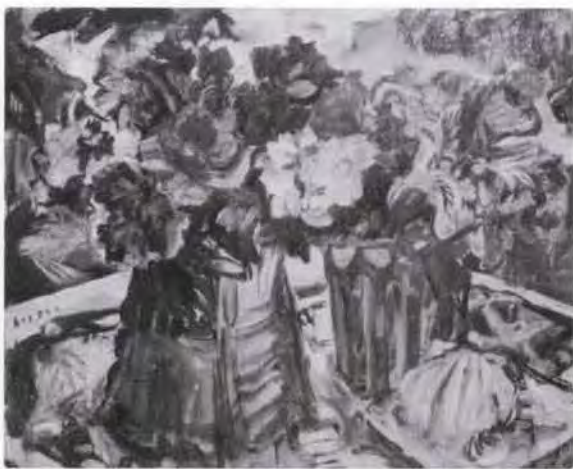
25 有馬さとえ (1893~1978) 花と貝がらの卓 1963 油彩・キャンバス 73.0×91.0 56. 贈 美工-690