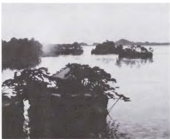
91 和田 英作 (1874~1959) 松島五大堂 1918 油彩・キャンバス 80.3×100.0 57. 購 美工-908