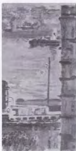
12 有馬さとえ (1893~1978) 上 海 1943 油彩・キャンバス 33.5×16.0 56. 贈 美工-678