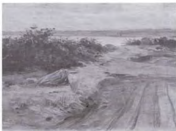
67 藤島 武二 (1867~1943) 海浜風景 油彩・キャンバス 23.0×33.0 49. 購 美工-181