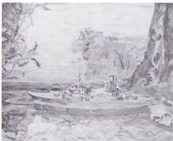
13 有馬さとえ (1893~1978) 船 1944 油彩・キャンパス 73.0×91.0 56. 贈 美工-679