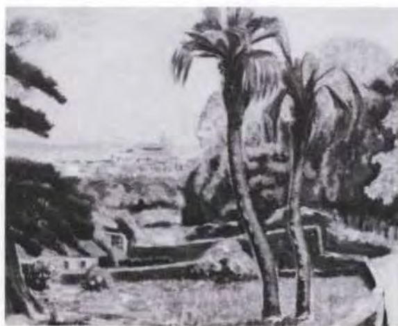
79 山口 祥 風景 油彩・キャンバス 65.0×80.0 50. 贈 美工-211