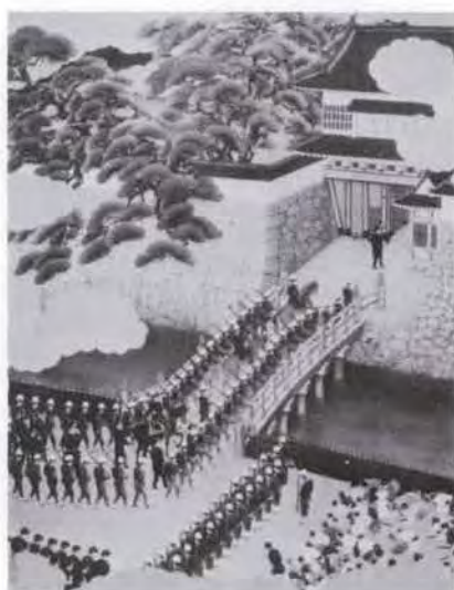
34 石原 紫山 (1905~1978) 明治天皇御巡幸鹿児島着御之図 1958 油彩・キャンバス・模写 270.0×220.0 原画・山内多門 57. 贈 美工-943