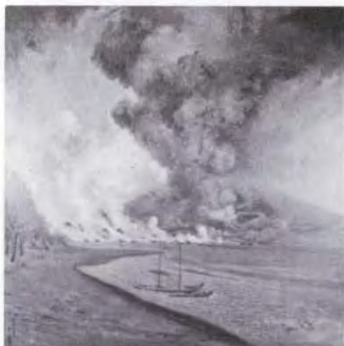
81 山下 兼秀 (1882~1939) 熔岩の流出状況 1914 油彩・キャンバス 182.0×182.0 50. 保転 美工-214