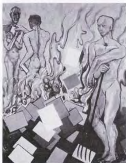
36 海老原喜之助 (1904~1970) 本を焼く人 1954 油彩・キャンバス 162.5×131.0 47. 購 美工-86