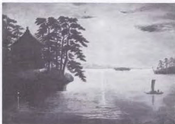
63 床次 正精 (1842~1897) 松島の図 1891 油彩・キャンバス 42.5×57.5 54. 購 美工-564