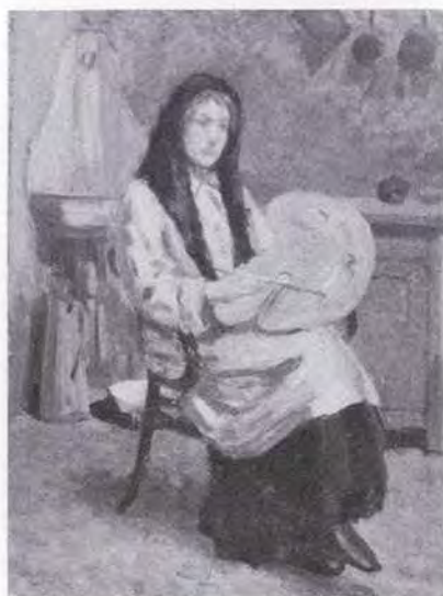
6 有島 生馬 (1882～1974) 画室 1908 油彩・キャンバス 61.0×50.0 48. 購 美工-116