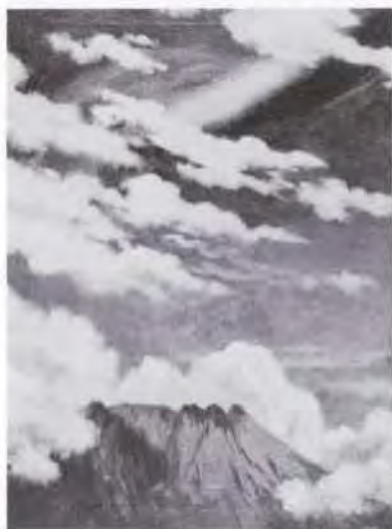
39 大牟礼南島 (1876~1935) 五彩雲 油彩・キャンバス 60.5×45.5 50. 贈 美工-218