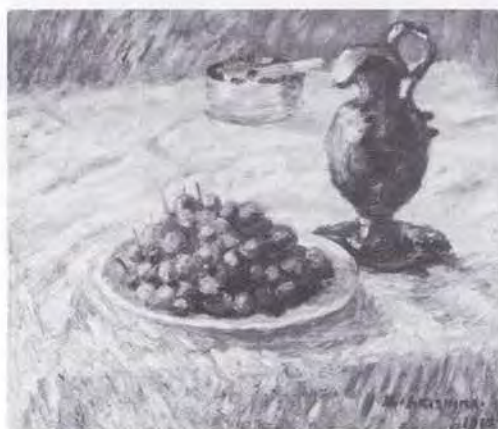
5 有島 生馬 (1882～1974) 桜桃 1913 油彩・キャンバス 38.0×45.5 47. 購 美工-103