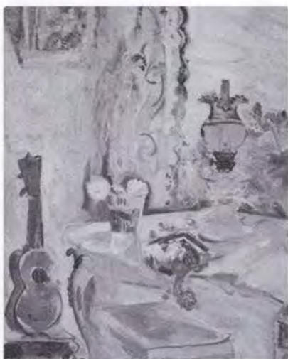
21 有馬さとえ (1893~1978) ウクレレのある静物 1953頃 油彩・キャンバス 116.8×91.2 56. 贈 美工-699