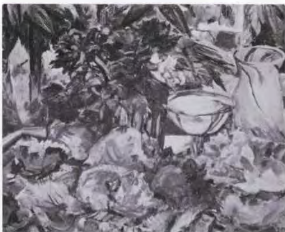
27 有馬さとえ (1893~1978) 窓辺の記 1966 油彩・キャンバス 80.5×100.0 56. 贈 美工-692