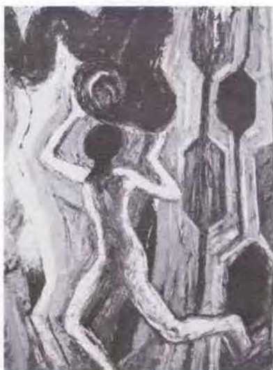
37 海老原喜之助 (1904~1970) 火を運ぶ 1962 油彩・キャンバス 130.3×97.5 47. 購 美工-87