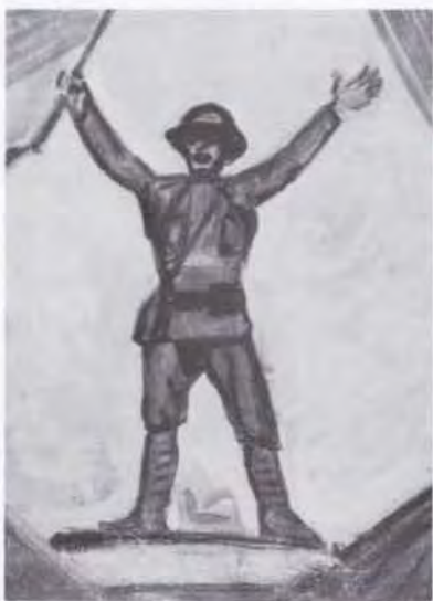
70 藤島 武二 (1867~1943) 兵士の像 1942頃 油彩・キャンバス 60.5×46.0 53. 購 美工-493