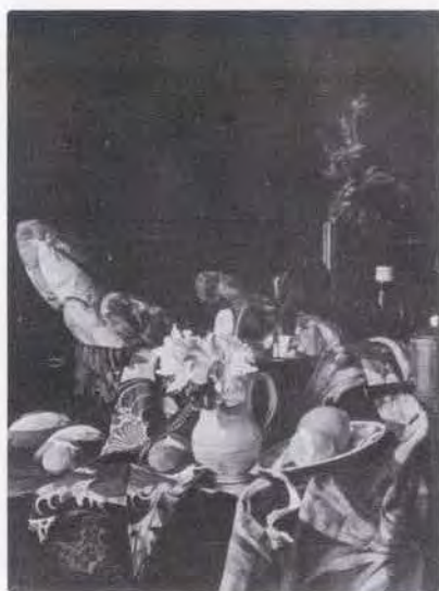
4 安達真太郎 (1906～ ) 静物 1975 油彩・キャンバス 91.5×73.0 54. 贈 美工-591