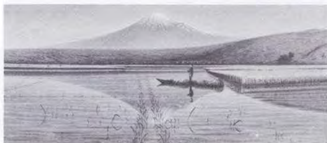
54 時任 鷗熊 (1874~1932) 富士 1901 油彩・キャンバス 56.0×132.0 51. 購 美工-252