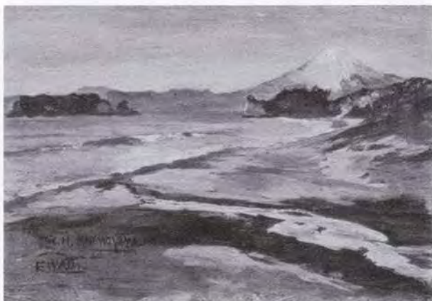
87 和田 英作 (1874～1959) 七里ヶ浜 1893 油彩・キャンバス 23.5×34.0 49. 購 美工-182