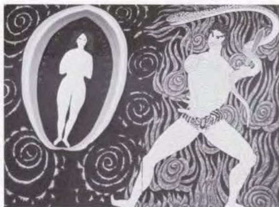
75 山内 一彦 日月屏風(部分) 1963 油彩・キャンバス 194.0×780.0 6枚組 47. 贈 美工-106