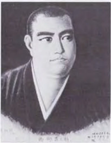
71 牧 重竹 断髪当時の西郷隆盛 1983 油彩・キャンバス 45.0×37.0 58. 贈 美工-1008