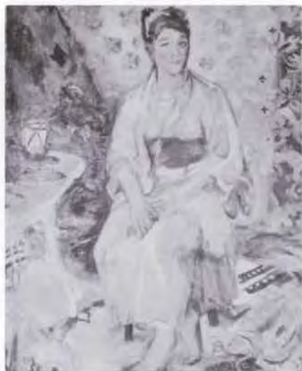
15 有馬さとえ (1893~1978) 秋果のある部屋にて 1948 油彩・キャンパス 116.5×90.5 56. 贈 美工-681