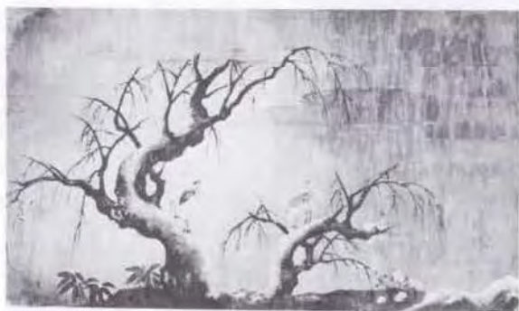
50 曾山 幸彦 (1859~1892) 白鷺 油彩・キャンバス 24.3×41.0 55. 購 美工-670