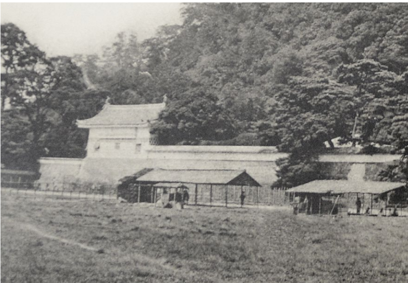
明治 5(1872) 年拍摄的城角箭楼