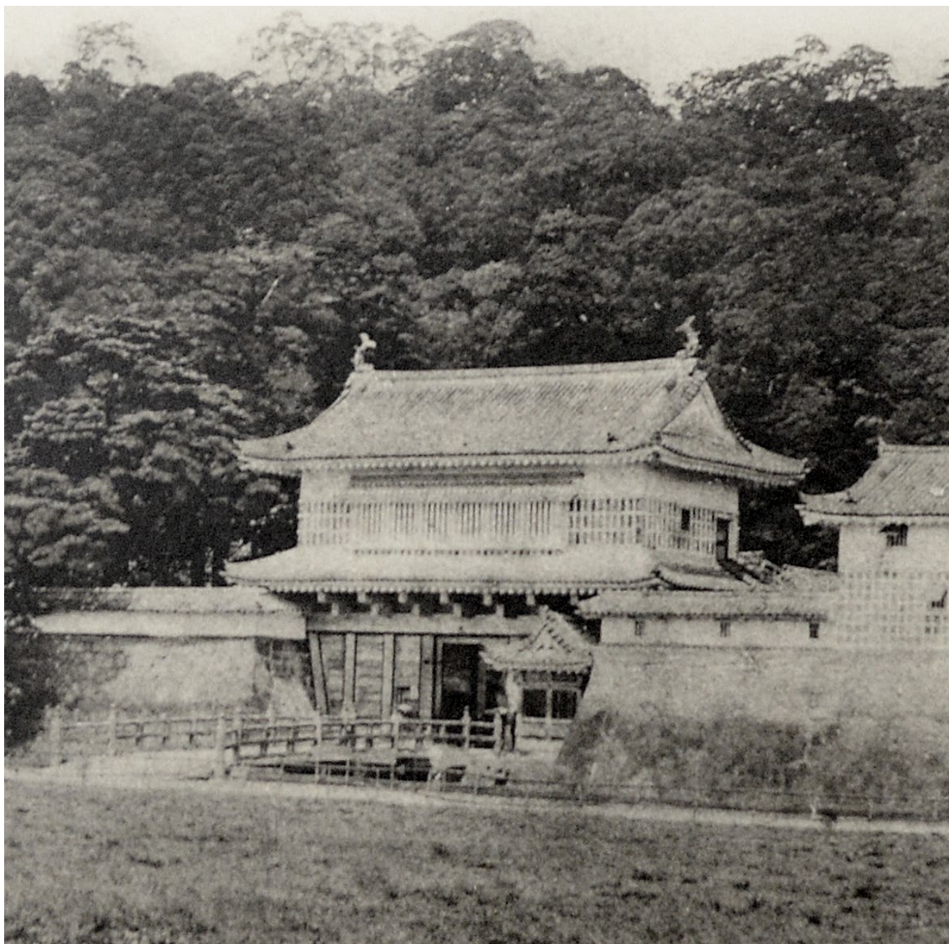
▲明治 5(1872) 年的楼门

关于楼门上的兽头瓦，在江户时代后期施行的修复时，留下了“换上唐金(青铜制)之物”的纪录，自此于平成、令和时的楼门建设之际，也都采用青铜制。