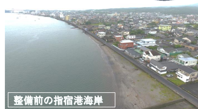
整備前の指宿港海岸