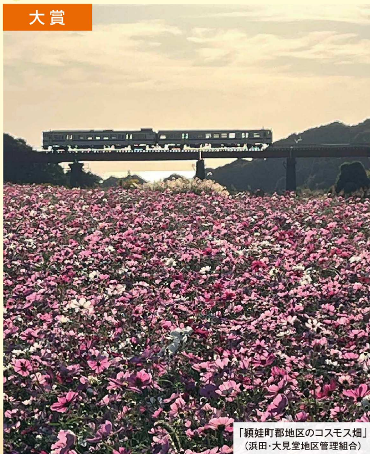
「穎娃町郡地区のコスモス畑」 (浜田・大見堂地区管理組合)