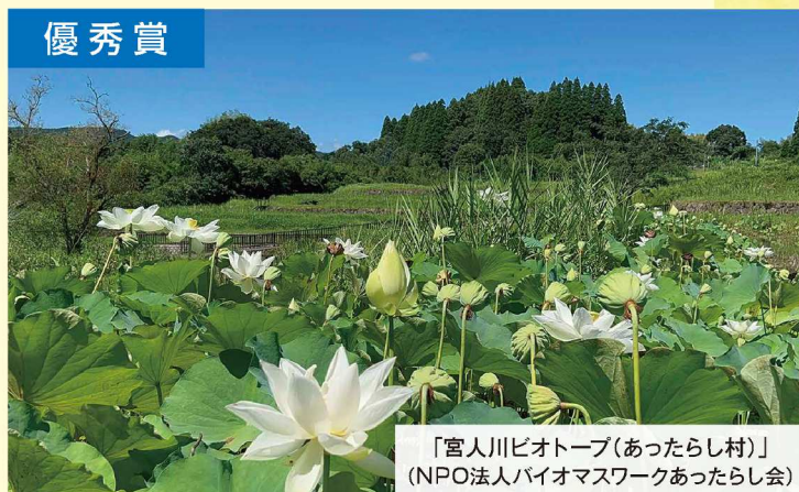
「宮人川ピオトープ(あつたらし村)」 (NPO法人バイオマスワークあつたらし会)