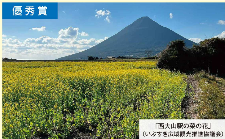
「西大山駅の菜の花」