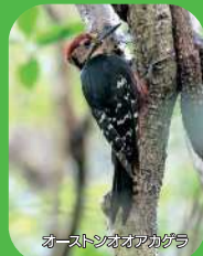
カーソンオオカゲ

第二の人生をゆっくりと豊かに送るために、あるいは、マリンスポーツを十分に楽しむために、「かごしまの島々」に移り住む方々が増えてきています。