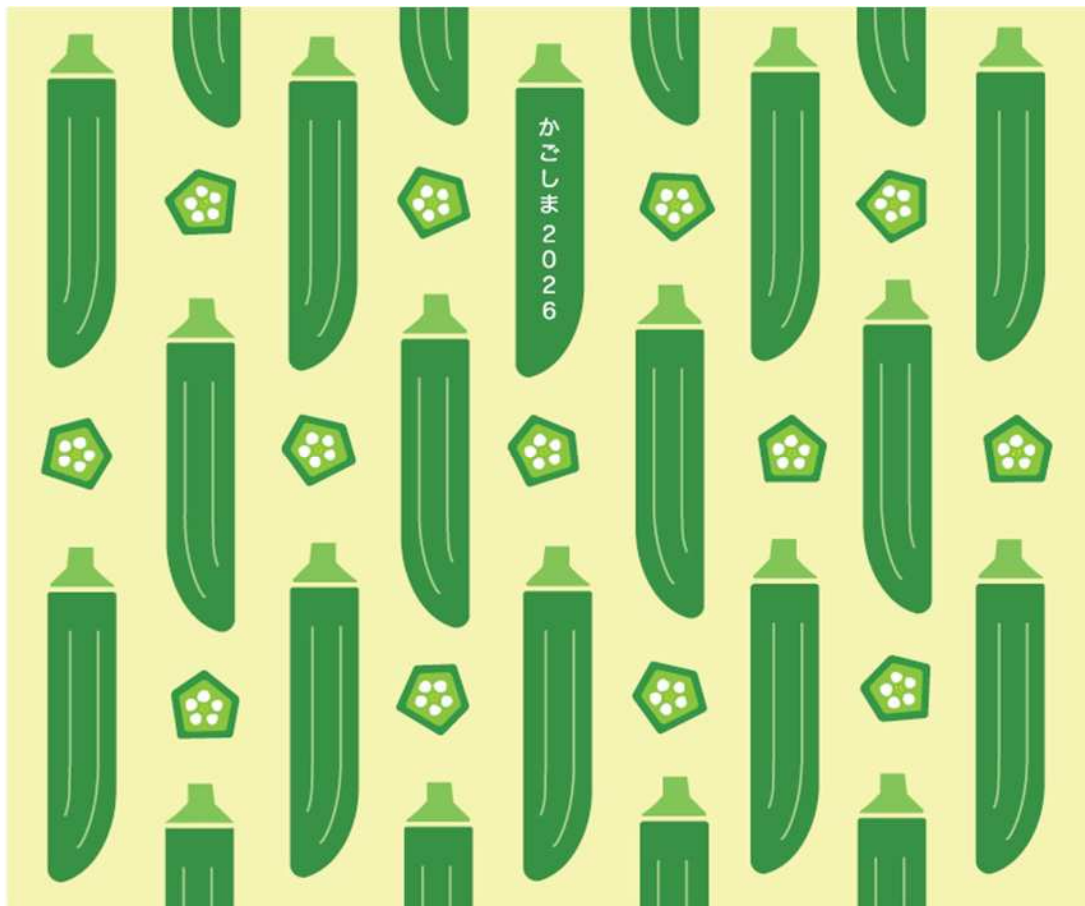
(参考 2-4) 提出データ (事例 2)