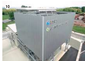
● さつま町バイオマス発電所