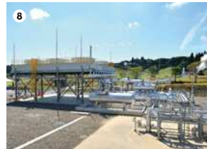
● メディポリス指宿発電所