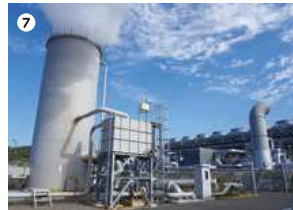
● 山川バイナリー発電所