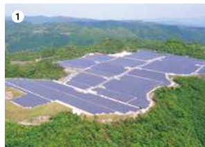
● 日置養母太陽光発電所