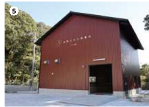
● 泊野川水力発電所