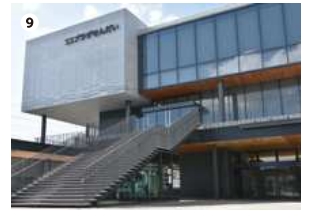
● S S プラザせんだい