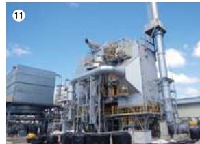
● 枕崎バイオマス発電所

事業者：枕崎バイオマスエナジー 合同会社・枕崎バイオマス リソース合同会社 種類：木質バイオマス発電