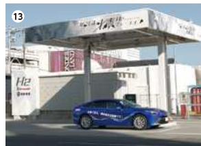
● かごしま水素ステーション