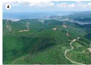
● 柳山ウインドファーム風力発電所