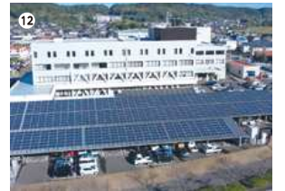
● 日置市役所（ひおきコンパクトグリッド）

事業者：枕崎バイオマスエナジー 合同会社・枕崎バイオマス リソース合同会社 種類：木質バイオマス発電