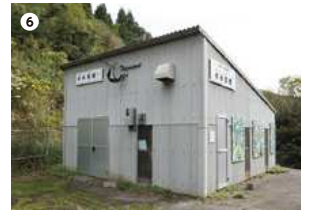
● 永吉川水力発電所