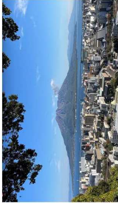
城山展望台からの眺望

※ 上記の考え方を踏まえた、新たな総合体育館の景観イメージについては、別途参考資料3で整理