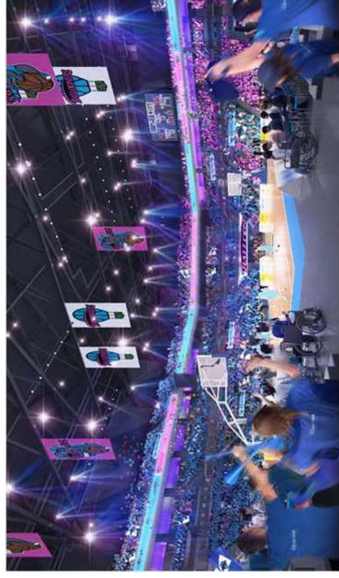
プロスポーツでの利用イメージ：SAGAアリーナ