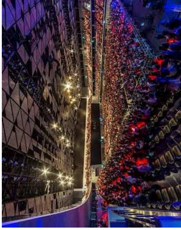
コンサートでの利用例：武蔵の森総合スポーツプラザ