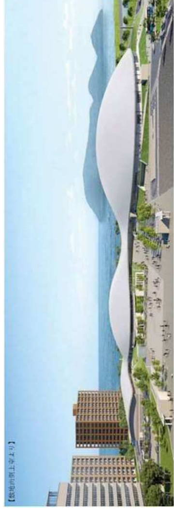
周辺の景観に調和したデザインとした新香川県総合体育館の例 (高さを低く抑えた曲線状で構成)