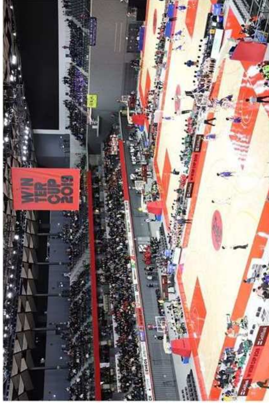
全国大会での利用例：武蔵の森総合スポーツプラザ