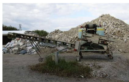
中山鉄工所製 振動篩機