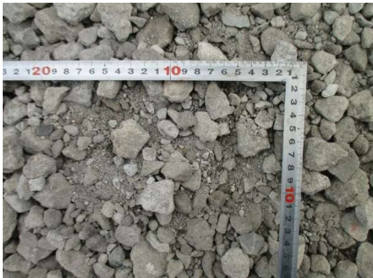
製品 再生路盤材（RC-30） (Co 90% As10%)