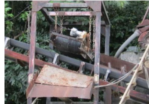
磁選機で金属類の除去