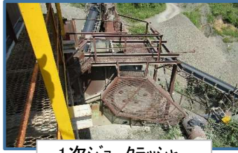
1次ジョークラッシャー