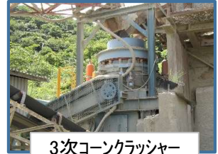
3次コンクラッシャー