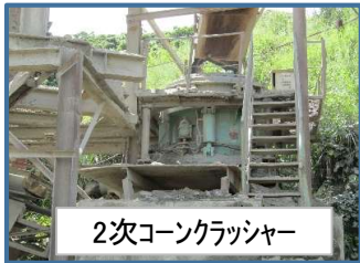
2次コンクラッシャー