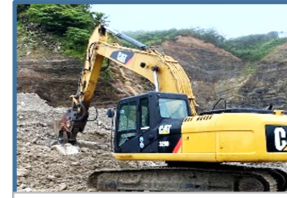
磁選機付き小割機

小割した後、タイヤショベルで、Co3 As1 新材1の割合で混合し原料ビンに投入