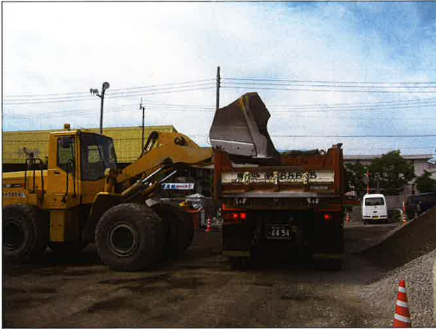
再生路盤材 積み込み状況 各工事現場へ搬入