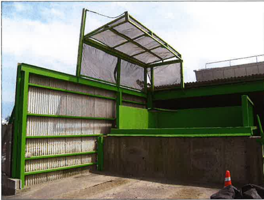
粉塵対策③ (防塵ネット)