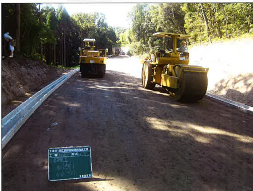
再生路盤材 転圧状況 (工事現場)