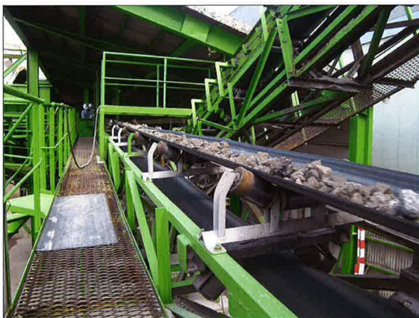
オーバーサイズベルコン