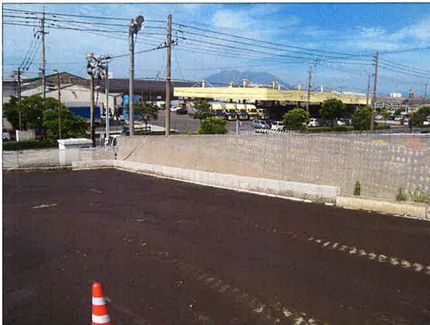
粉塵対策④ (防塵ネット) (スロープ・置場も散水)