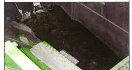
選別状況 (50mm以上・以下)