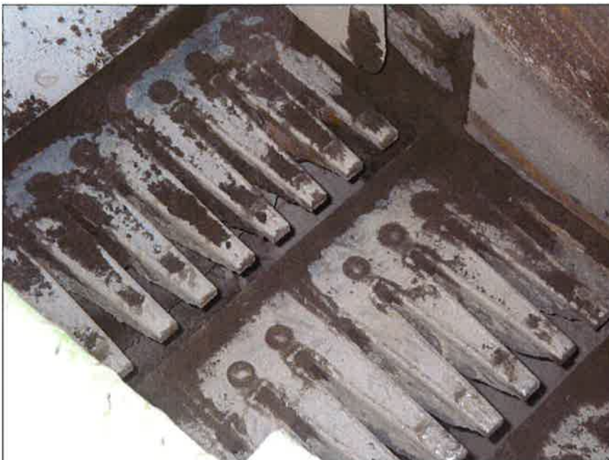
グリズリフィーダ