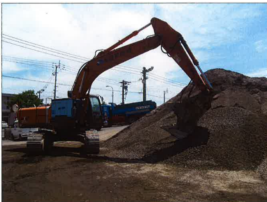
鉄筋除去⑤（磁選付小割り機）