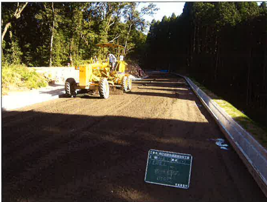
再生路盤材 敷均し状況 (工事現場)