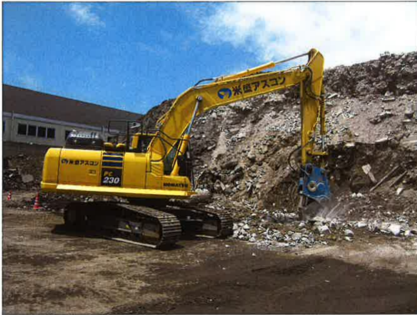
小割り状況（磁選付小割り機） （鉄筋・異物除去①）