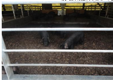
豚舎用敷料として使用