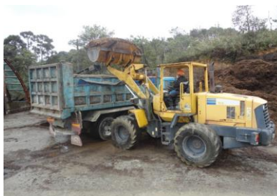
注文があり次第、製品を出荷