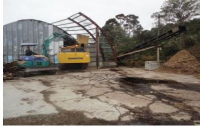
破碎機 (BR120T型) にて破碎