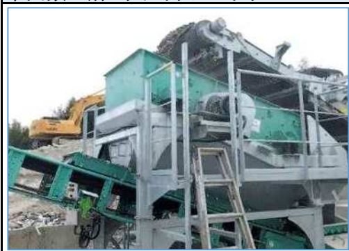
中山鉄工所 リサイクルスクリーン NHS482