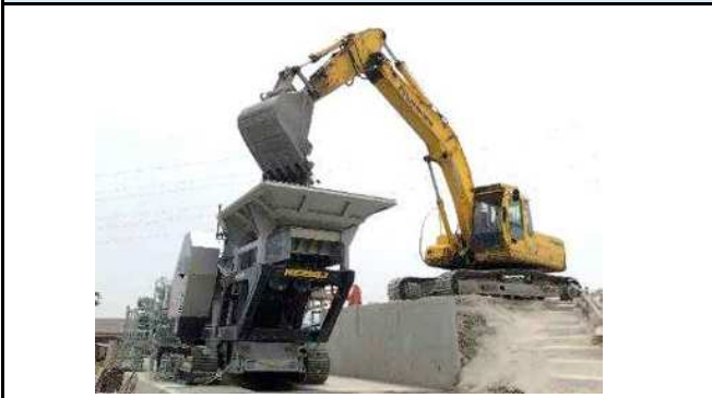
バックホウにて投入