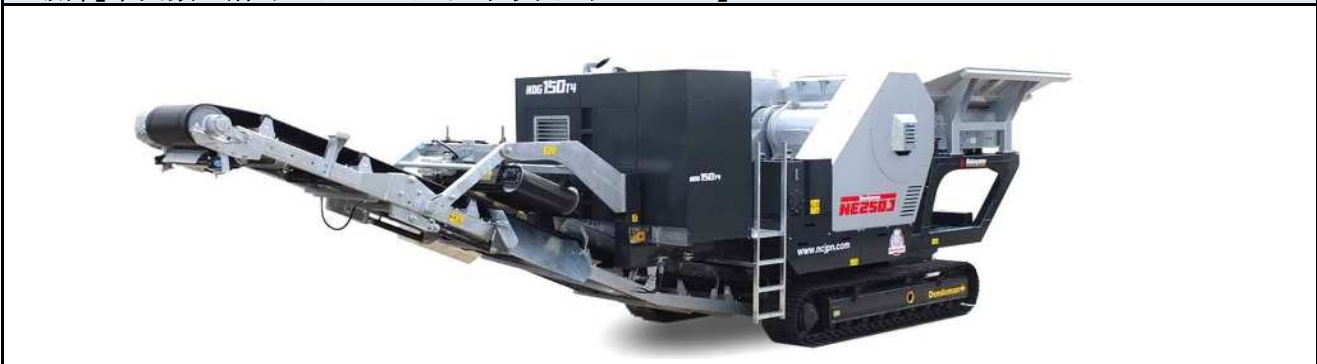
破碎【中山鉄工所 デンドマン ジョークラッシャ NE250J】