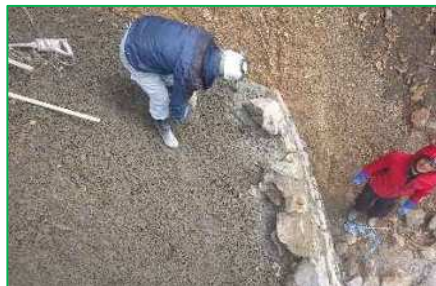
ブロック等の裏込材