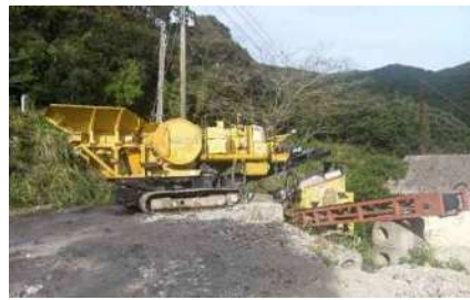
移動式破碎機（コマツBR100JG）