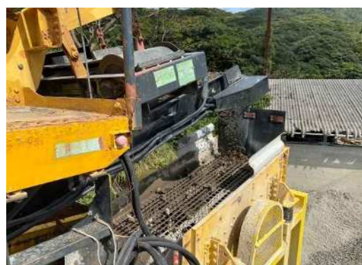
振動ふるい機で選別