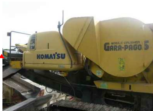
破碎機に磁選機付属