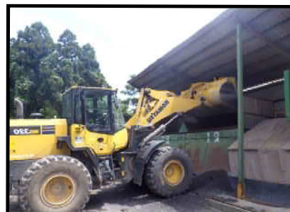
再生骨材をホッパーに投入