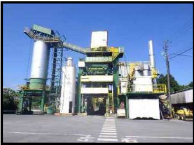
再生アスファルト製造プラント全景