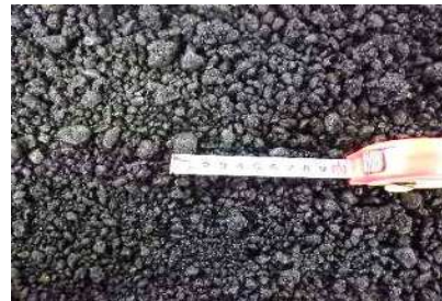
製品【再生密粒度アスコン(13)50回】