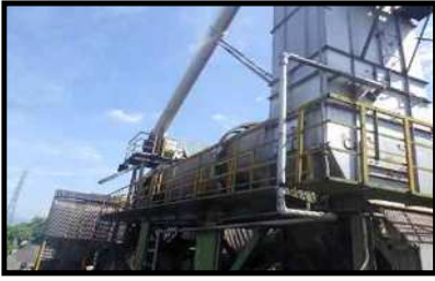
再生骨材加熱ドライヤー