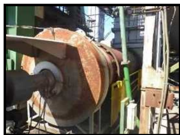
新規骨材加熱ドライヤー