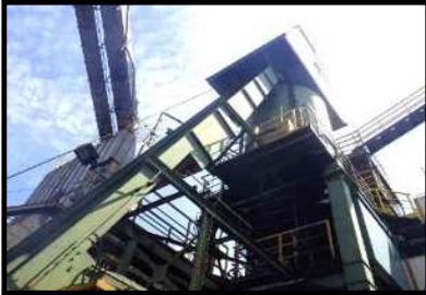
再生骨材をサージピンへ貯蔵