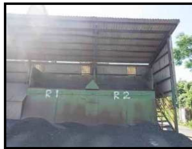
再生骨材ホッパー