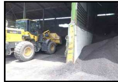
ストックヤードから