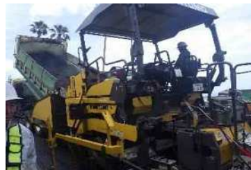
フィニッシャーへ投入