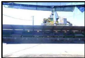
コールドホッパー