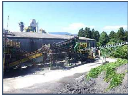
再生骨材製造プラント全景