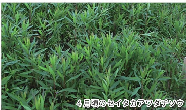
4月頃のセイタカアワダチソウ