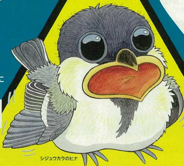
シジウカラのヒナ