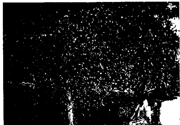
民家付近で異常発生したヤンバルトサカヤスデ