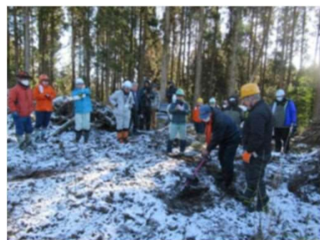
柁樹による植穴掘り状況