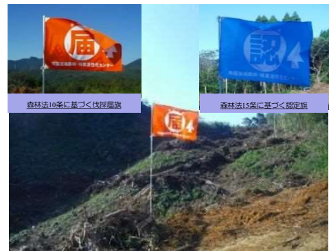
伐採届旗、認定旗の掲揚