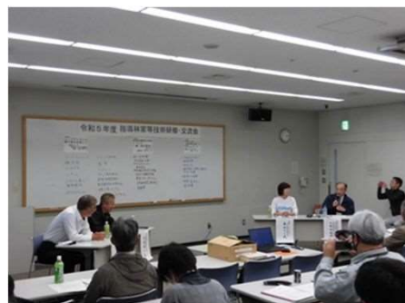
意見交換会の状況