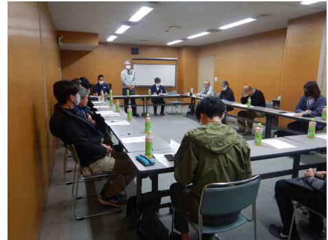
鹿児島地域森林整備推進会議