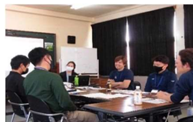
コミュニケーション研修