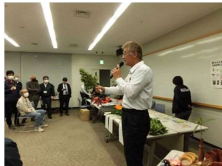
種子島しきみ生産組合