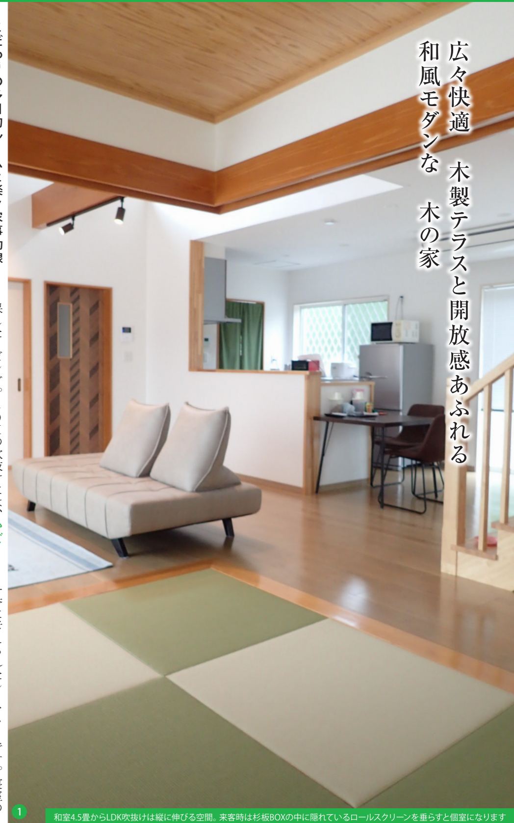
1 和室4.5畳からLDK吹抜けは縦に伸びる空間。来客時は杉板BOXの中に隠れているロールスクリーンを垂らすと個室になります