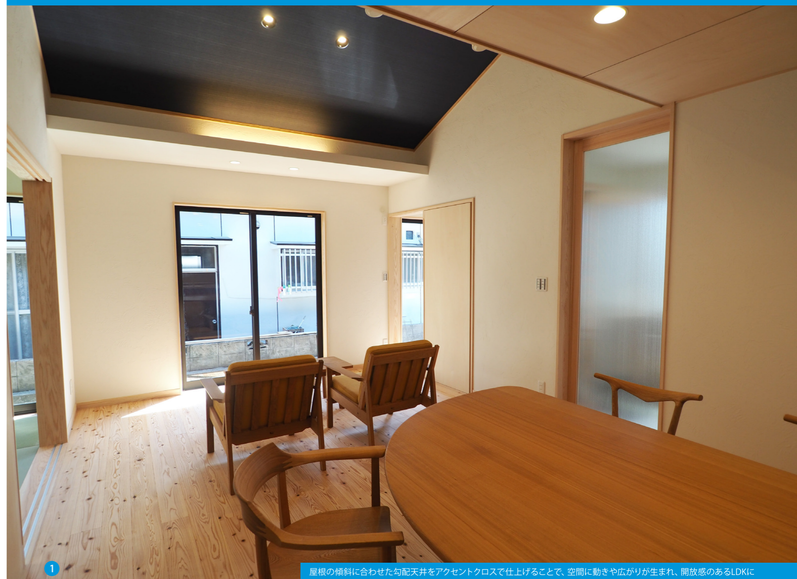
1 屋根の傾斜に合わせた勾配天井をアクセントクロスで仕上げることで、空間に動きや広がり生まれ、開放感のあるLDKに