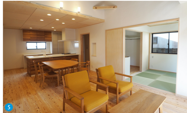
5 2枚の片引き戸を開放することでリビングと和室を一体化して利用することもできます