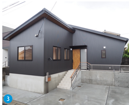
3 外壁には耐久性に優れたガルバリウム銅板を採用。段違い屋根と斜めの袖壁で変化をつけ、シンプルながらも飽きのこないデザイン