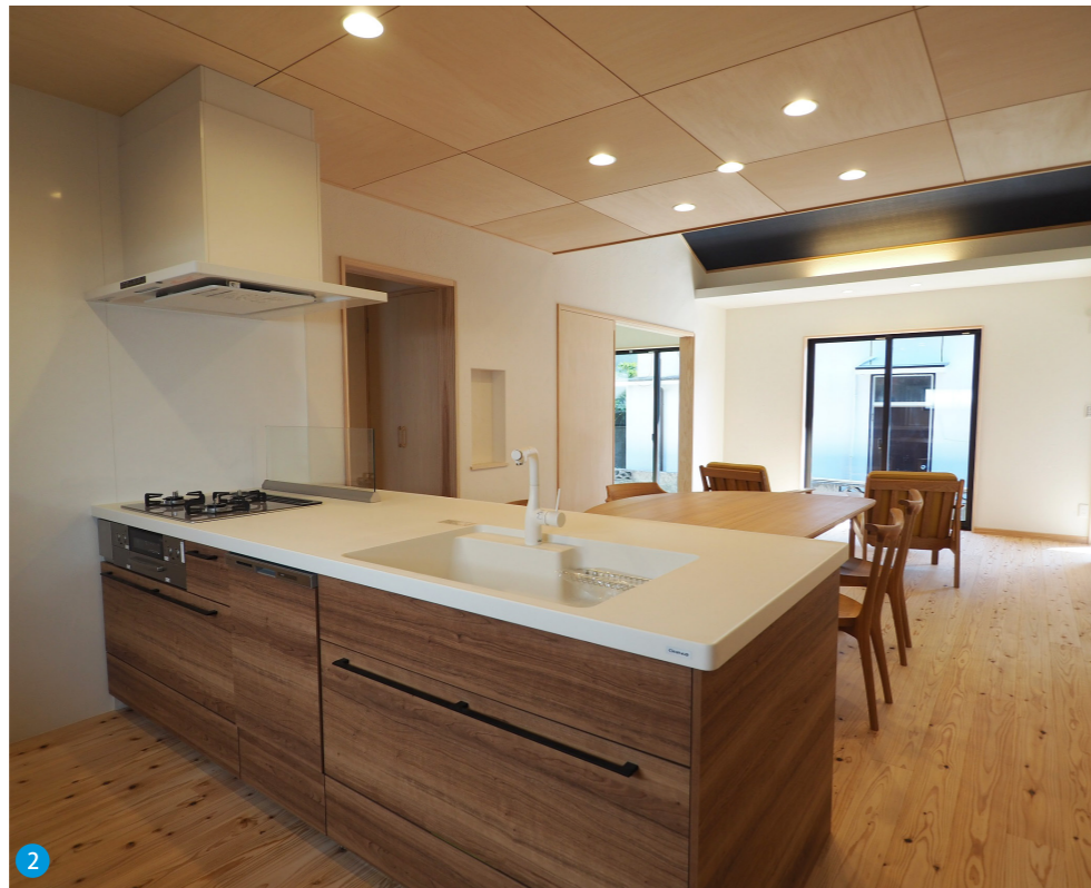
2 床材にかごしま材を使用したキッチン・ダイニング・リビングは一直線に配置しているので、料理をしながらも家族の様子を伺うことができます