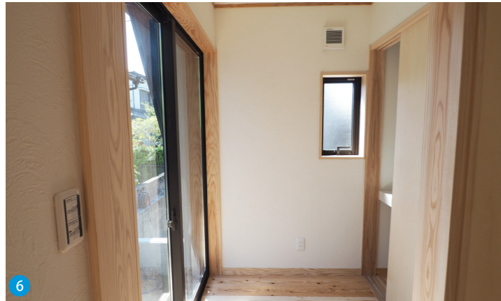
6 いつでも洗濯物を干せるリビング横のサンルームにもかごしま材を使用。リビングの収納も兼ねているので、片付けがスムーズ