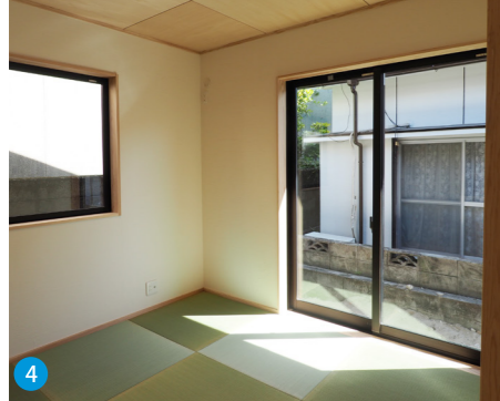
4 客間としても家事室としても、使い勝手のいい和室