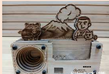
木製スピーカー （一般枠）