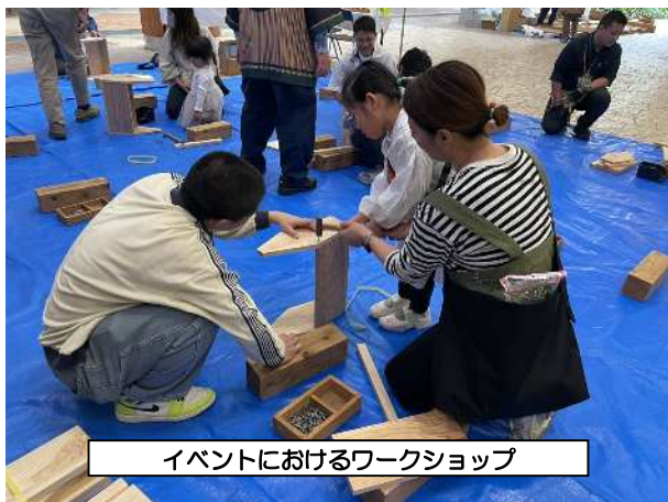
イベントにおけるワークショップ