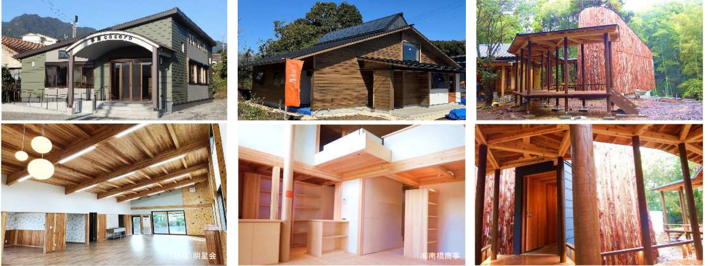
施設の木造化（左：学童保育施設、中央：ショールーム、右：入浴施設）

県産材を積極的に活用したデザイン性・機能性等に優れた施設の木造化、内装木質化及び木製品の設置に関する取組に対して助成します。