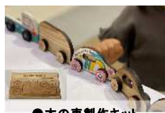
●木の車製作キット