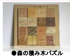
●森の積み木パズル