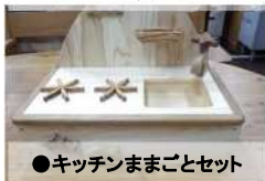
●キッチンままごとセット