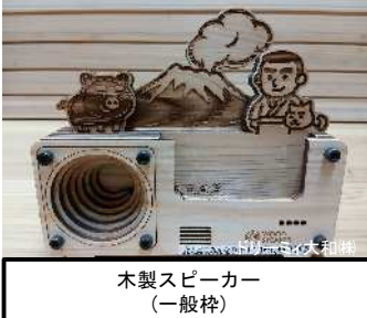
木製スピーカー （一般枠）