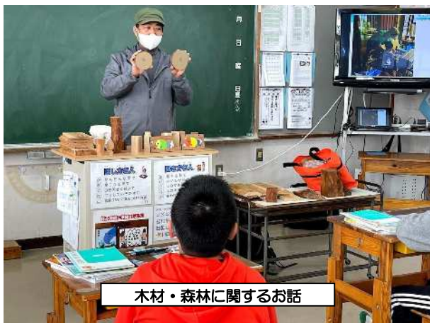
木材・森林に関するお話