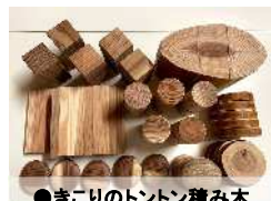
●きこりのトントン積み木