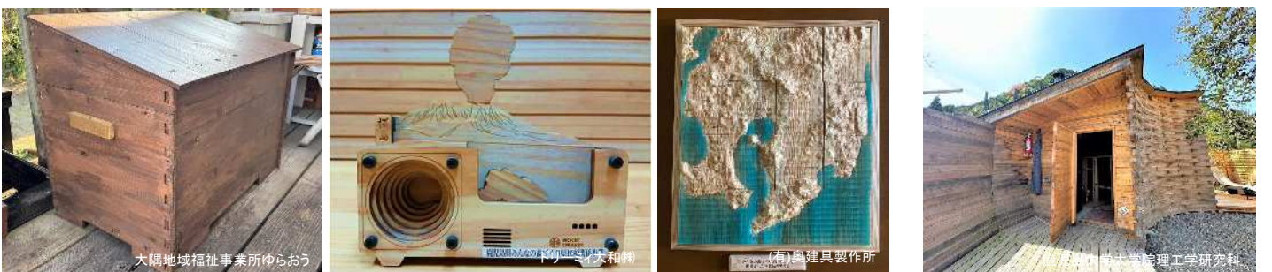
一般枠（左：木製コンポストボックス、中央：木製スピーカー、右：3D型の木製シグソーパネル）

県産材の需要拡大につながる新たな木製品の開発及び普及に関する取組に対して助成します。（「一般枠」及び「学生デザイン活用枠」）