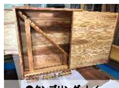
●タンブリングトイ