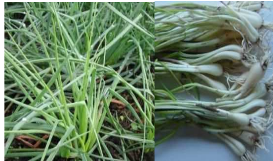
【島らっきょう】 (主な栽培地域) 奄美市 (H 2 9 栽培面積) 1.9 ha