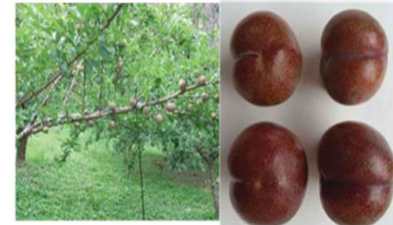
【奄美プラム】 (主な栽培地域) 奄美市, 大和村 (H 2 9 栽培面積) 6.5 ha