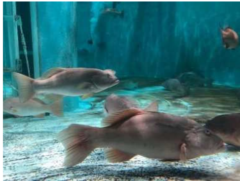
スジアラ親魚養成