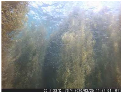
仕切り網により回復した藻場