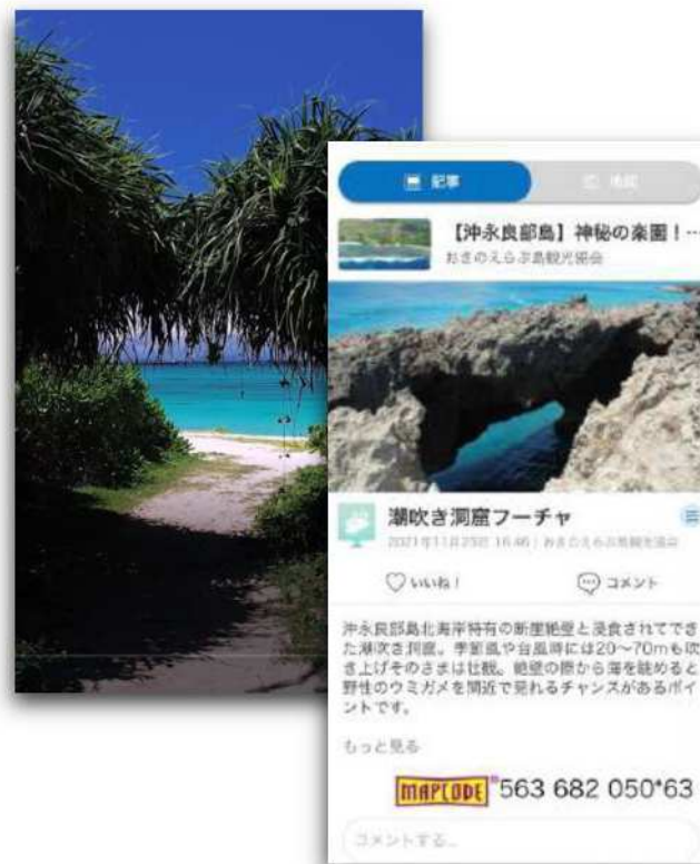
沖永良部島，与論地域表示コンテンツ