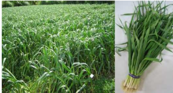
【葉にんにく】 (主な栽培地域) 奄美市, 大和村 (H 2 9 培面積) 1.8 ha