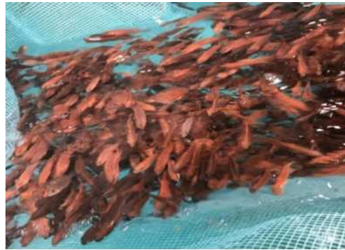
出荷するスジアラ稚魚