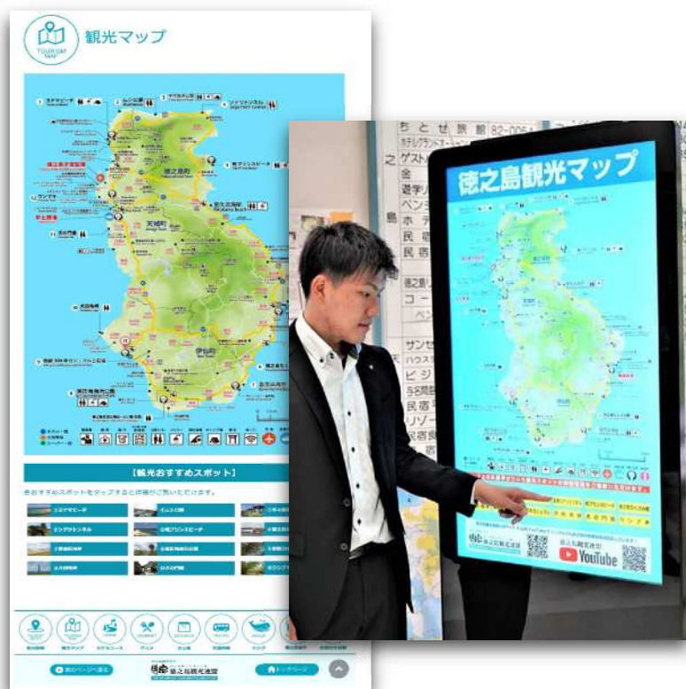
デジタルサイネージ（徳之島）

徳之島，沖永良部島，与論島へ来島した観光客へ各島の空港及び港，おきのえらぶ島観光協会に到着した場合の観光案内の電子看板の設置費の助成を行った。