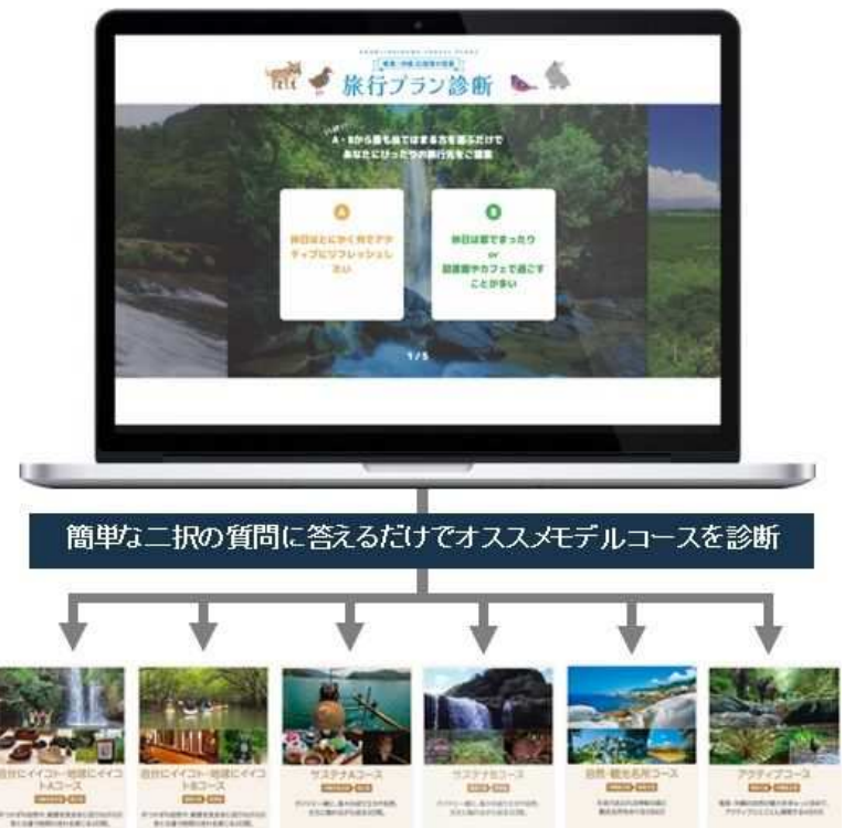
モデルコース・「旅行プラン診断」作成