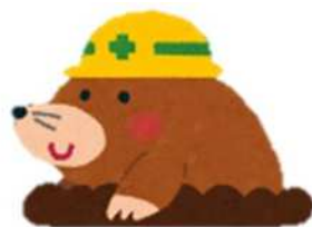
生物多様性に配慮した 森林管理・公共事業