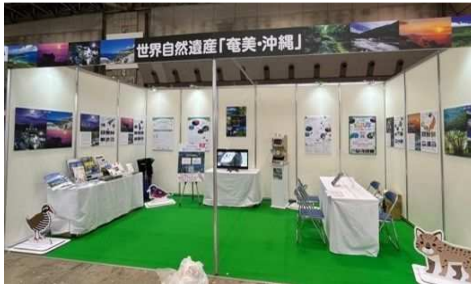
ツーリズムEXPOジャパン出展（東京都）