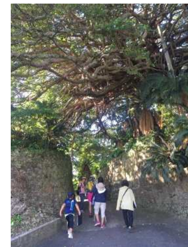
トレイルの利用促進