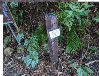
利用ルールの周知 ・モニタリング