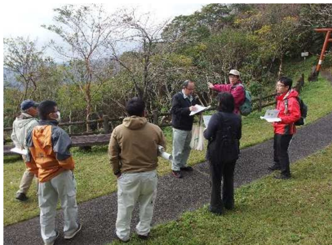
公共事業配慮指針（アドバイザー研修）