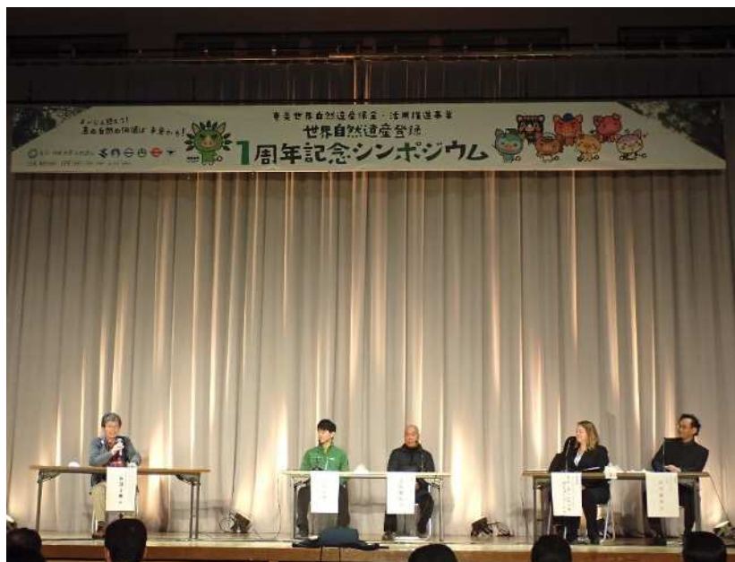
奄美大島（令和5年1月22日）

奄美大島，徳之島，沖縄島北部及び西表島が世界自然遺産に登録されて1周年を迎えたことから奄美大島・徳之島において，「世界自然遺産登録1周年記念シンポジウム」を開催した。