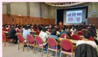
県内の初期研修医が、自分が経験した症例について発表を行いました。