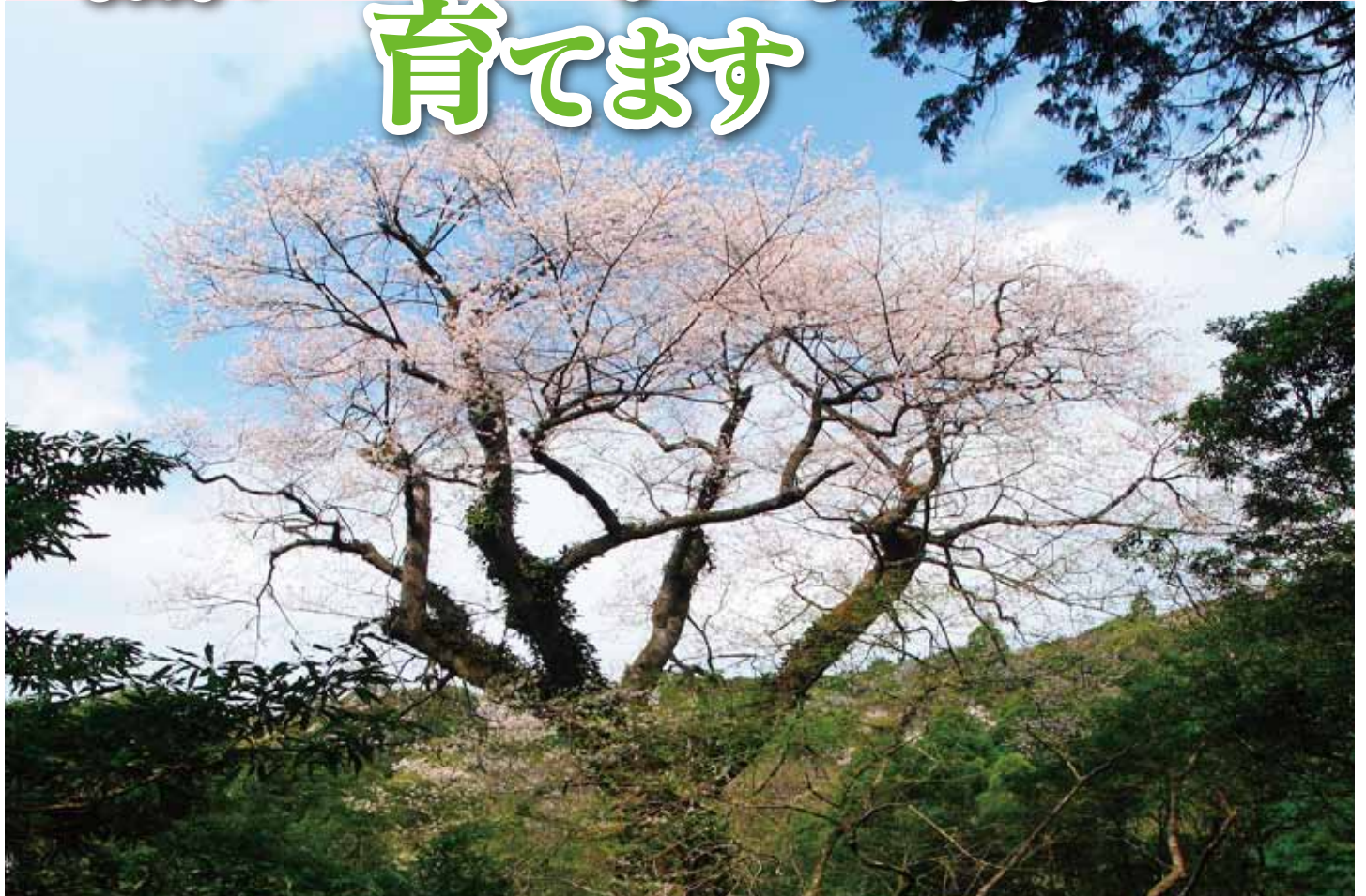
奥十曾溪谷のエドヒカンザクラ（伊佐市）