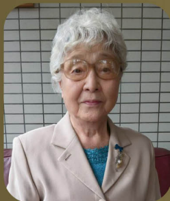
横田 早紀江 さん