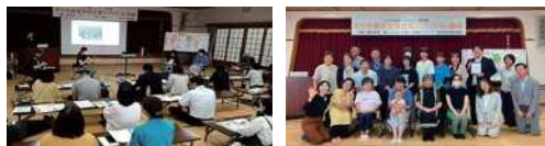
▲子ども食堂支援企業マッチング in 南薩