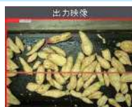
AIによるサツマイモ選別の様子

AIが商品等の外観検査を行うシステムや顧客管理システムなど、各企業の課題に応じたデジタル技術を導入することで、 生産や業務の効率化 が図られています。