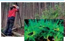
地上レーザを用いて立木の本数や形状を計測した画像

航空レーザや地上レーザを活用し、森林資源情報をデジタル化することで、 森林調査の省力化や精度の向上 が図られています。