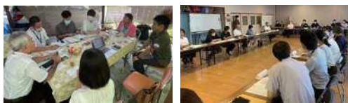
▲奄美子ども食堂・地域食堂 ネットワーク話し合いの様子 ▲薩摩川内市子ども食堂 (コミュニティ食堂) ネットワーク話し合いの様子

今年度は、薩摩川内市、南九州市、始良市、奄美大島、徳之島で進められる拠点づくりを支援します。