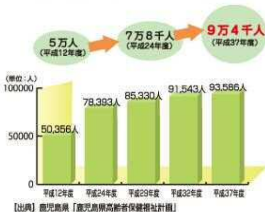
介護サービス利用者数の推移と見込