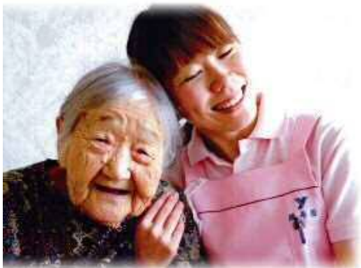
「ほっこり」特別養護老人ホーム訪問員 (介護フォトコンテスト作品)

A 福祉・介護の仕事は、一人で日常生活を営むことが困難な人に寄り添い、支えていく仕事で、人との関わりの中で、人の役に立つ喜びを実感することができる仕事です。