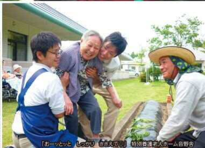
「ホーッとと しっかり きこえて!!」 特別養護老人ホーム音野舎