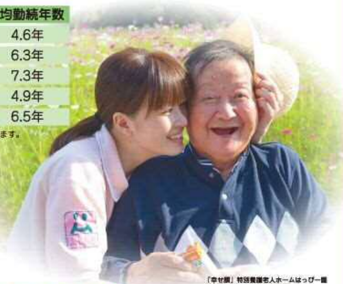
【幸せ顔】特設養護老人ホームほっぴー園 (介護フォトコンテスト作品)