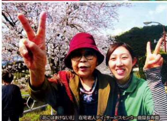
「花にはおけない!!」 在宅老人デイサービスセンター鹿屋長寿園