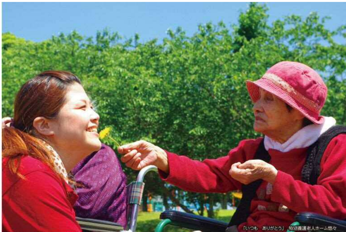
「いつも ありがとう」 特別養護老人ホーム悠々