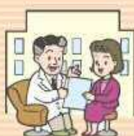
● 看護・保健・医療