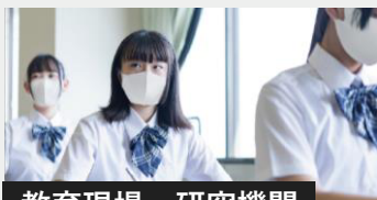
教育現場・研究機関

お客様訪問がある接客クルーやどうしても出社せざるを得ない職場でも、安心して働けることを目指します。