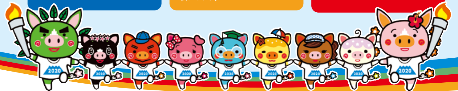
マスコットキャラクター ぐりぶファミリー

「本物。鹿児島県」の多彩な魅力を、国体と一体となって全国に発信するとともに、熱戦を繰り広げる選手たちの熱い思いや応援が、南の風に乗ってみんなに届く大会にします。