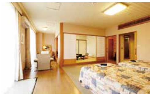
バリアフリー対応の露天風呂付和洋室 ほかユニバーサルルームは全5室