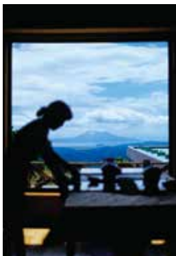
桜島を望む 抜群のロケーションが心を癒す