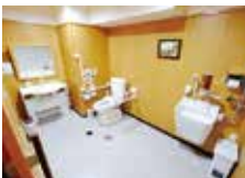
2階に設置された オストメイト対応の 多目的トイレ