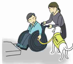
乗り越えられない段差の介助