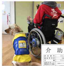
(左)介助犬とユーザー (右)介助犬の表示