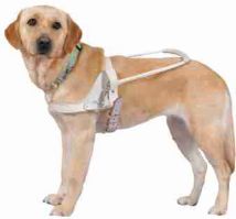
ハーネスを着けた盲導犬