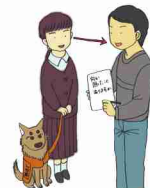
館内放送や電車内のアナウンスの伝達