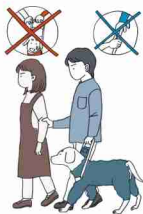
不慣れな場所への誘導

お困りの様子が見られたらユーザー本人に「何かお手伝いしましょうか」「どのようにお手伝いすればよろしいですか」などの声かけや筆談でコミュニケーションをとりましょう。