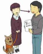
館内放送や電車内のアナウンスの伝達