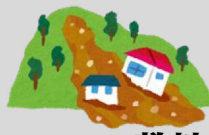
敷地内法面の崩壊対策