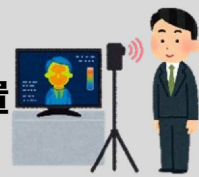
サーモグラフィカメラの設置