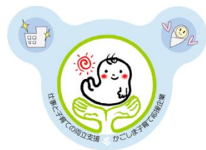
かごしま子育て応援企業登録マーク

県では、従業員の仕事と子育ての両立支援に積極的に取り組む企業を「かごしま子育て応援企業」として登録し、県のホームページ（HP）や広報誌を活用して県民の皆様に広報することによって、子育て支援への自主的な取組を促進しています。