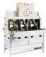
豚大腸切開機「ドームくん」(幅1.51m×厚さ1.46m×高さ1.76m)

何事も失敗の上に成功があると念じて、研究開発に邁進したいと思っています。今年はさらに、せせり自動切剥機「トリ・ドリ・ミドリ」をFOOMA展に出展したところ、ボンジリ以上の大きな反響があり、10月の販売を目指して改良中です。