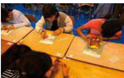
銅板折鶴体験(紫原小)