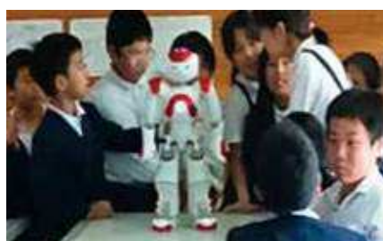
ロボットプログラミング体験(重富小)