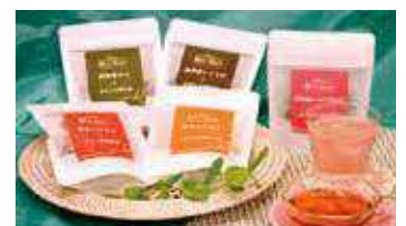
Ma cha-ippel 各種

将来的には、歴史と趣のある石蔵の店舗全体が立ち寄りやすく、談笑しながら、お茶を楽しんでもらえる憩いの場としての広がりを目指しています。