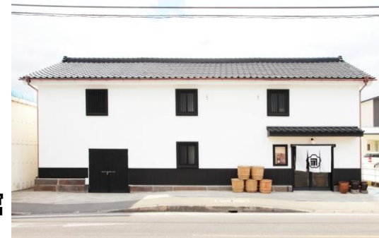
1927年創業 本社 サクラカネヨ直売所

ふるさと薩摩の隠し味！お刺身に合う甘いお醤油を選んでみませんか？ほのかにお醤油の香りも人気。隣接した本社で工場見学もできます。