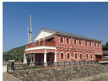
薩摩藩英国留学生記念館

19名の若き薩摩藩士が密かに英国へと旅立った地。留学までのいきさつや旅路、功績について、貴重な資料やミニシアターで紹介しており見応えがあります。