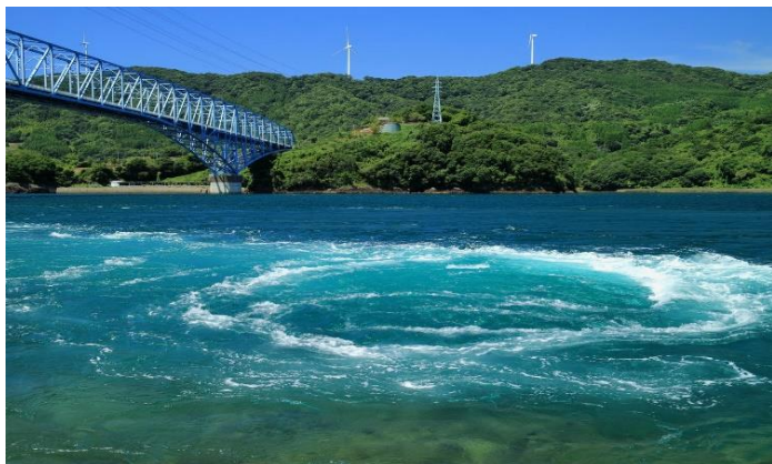
黒之瀬戸うずしお展望所 日本最大急潮のひとつ黒の瀬戸海峡 所在地 阿久根市脇本

阿久根 🌊 170種類の多様な魚種が獲れる！ 島津氏の統治下で、貿易と漁業で栄えた町！ 長島町はブリの養殖生産量日本一！ ウニや伊勢海老など旬の海の幸グルメイベントも魅力！