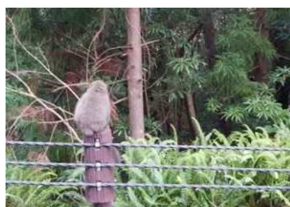
途中で見た2匹の鹿（ヤクシカ）と猿（ヤクサル）一家