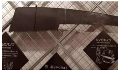
巨木用の巨大ノコギリ

輪切りにした巨大な円板も展示されて、数えきれない年輪は成長の遅い屋久杉の年齢がはっきりと分かりました。