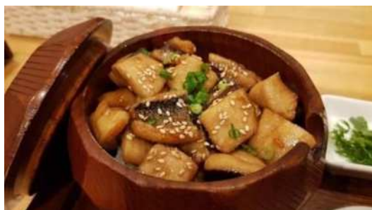
トビウオひつまぶし

夕食もおいしい郷土料理でした。今回は屋久島の特産トビウオのひつまぶしセットです。元々ウナギ料理のひつまぶしスタイルからトビウオでアレンジした食です。