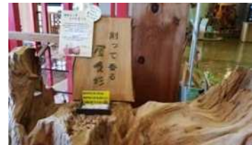
削って香る屋久杉の体験コーナー