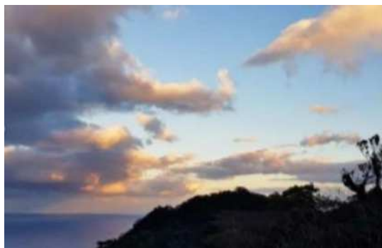
パステルカラーの空

九州最高峰の宮之浦岳がそびえたつ屋久島で、南の沖縄みたいな暖温帯から北の北海道みたいな冷温帯までの多様な植生がこの一つの島で成長していると教えてくれました。