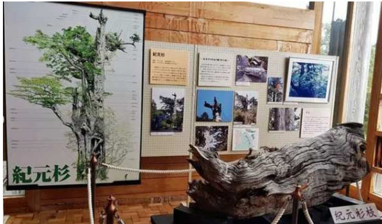
紀元杉の枝と着生植物の紹介

また、1本の屋久杉に多数の着生植物が生えていることも学びました。例えば、樹齢三千年の壮大な紀元杉だけで30種以上の植物が共存しています。