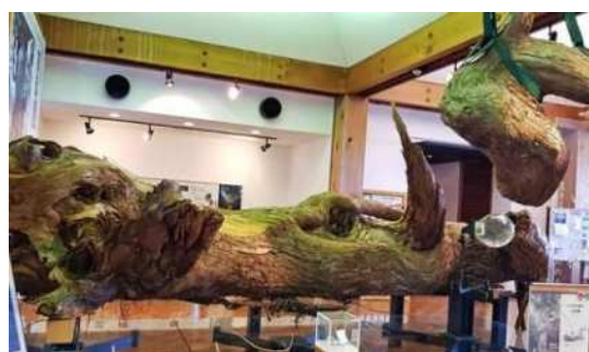
大雪の重さで折れた縄文杉の枝「いのちの枝」

屋久杉自然館は、屋久杉のすべてを知ることができる魅力的なところです。江戸時代の人々が使った道具をはじめ、今の保護状態から屋久杉の特徴までの展示や屋久杉に関する情報がたくさんあります。展示物を見ながら、杉の香りが空間に浸透し、すごく心地よい体験でした。