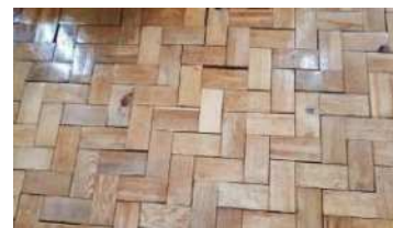
踏むといい音がする杉ブロックでできた床