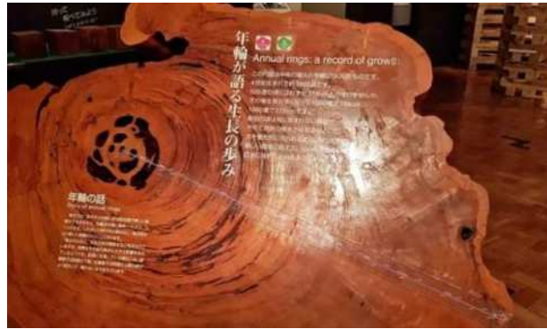
大きな円板にある古代からの年輪

また、1本の屋久杉に多数の着生植物が生えていることも学びました。例えば、樹齢三千年の壮大な紀元杉だけで30種以上の植物が共存しています。