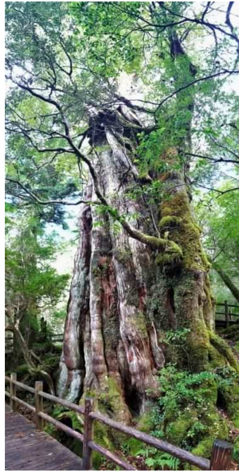
樹齡3千年の紀元杉