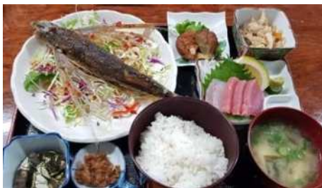
店「あわほ」での「トビウオ飛んだ定食」は美味しいし、名前もかわいい！

次は屋久島での最初の食事、地元名物料理のトビウオ定食です。トビウオを食べるのは初めてで、味も外観もすごかったです。