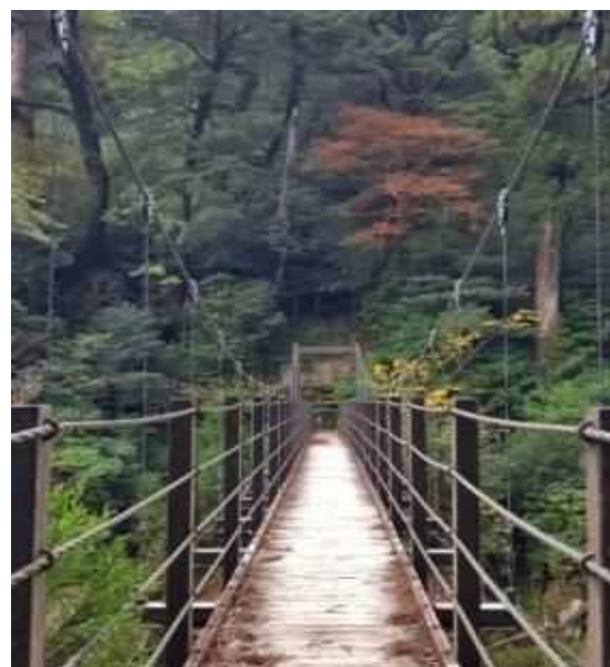
登山道がまだ楽だった頃の美しい吊り橋