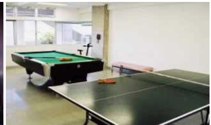
レクリエーション室