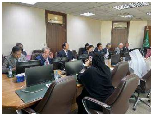
▲与环境・水资源・农业部进行意见交换