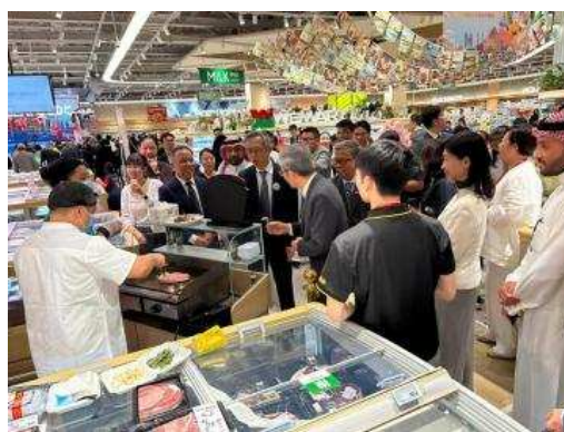
▲会场（和牛现场展示）现场