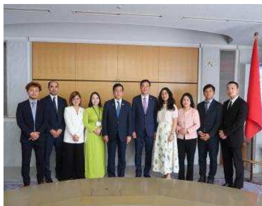
▲与越南大使馆各位的纪念合影