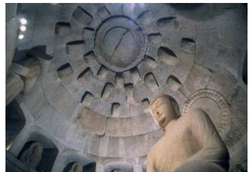
石窟庵本尊▶ 照片来源：庆州文化观光

石窟庵是在人工的洞窟中雕刻佛像的佛教遗迹，其佛像和雕刻具有卓越的艺术价值。双方都展示了新罗佛教文化的精髓，被称为韩国佛教史的重要遗产。在这平静庄严的氛围中能够感受内心的安宁。