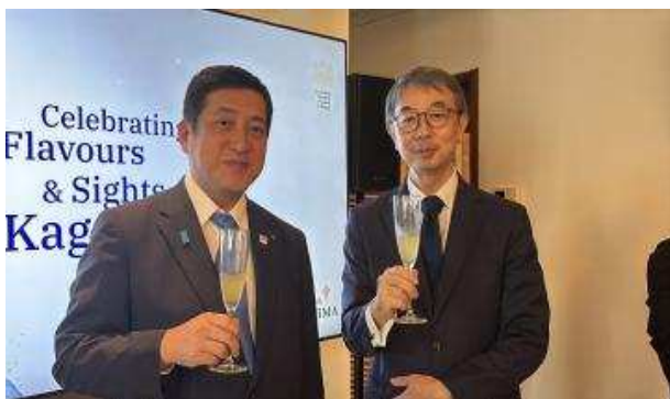
▲与在迪拜日本国今西淳总领事的纪念合影

参加此次招待会的各位对本县产品表现出了浓厚的兴趣与关注，让我们再次感受到本县产品蕴含的巨大潜力。