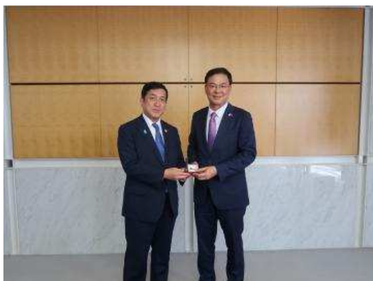
▲与越南驻日大使范光辉的合影

知事表示感谢大使一直以来对本县与越南交流的支持与协助，希望两国能够继续强化地区间的合作关系。