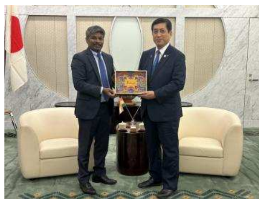
▲与总领事的纪念合影