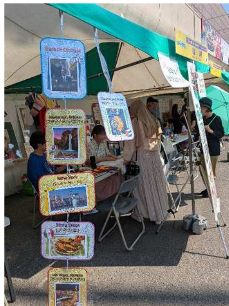
▲会场的样子(各国展位的样子)