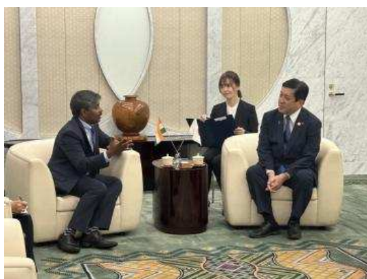
▲和总领事欢谈的样子

知事表示，非常感谢大使在本县举办的活动中的精彩演讲，希望大使能够对本县和印度之间的关系发展提供支持。同时，希望加深对国土面积广阔的印度各州特色的理解。