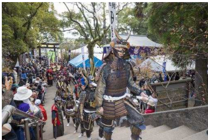
●照片来源：公益财团法人 鹿儿岛县观光联盟