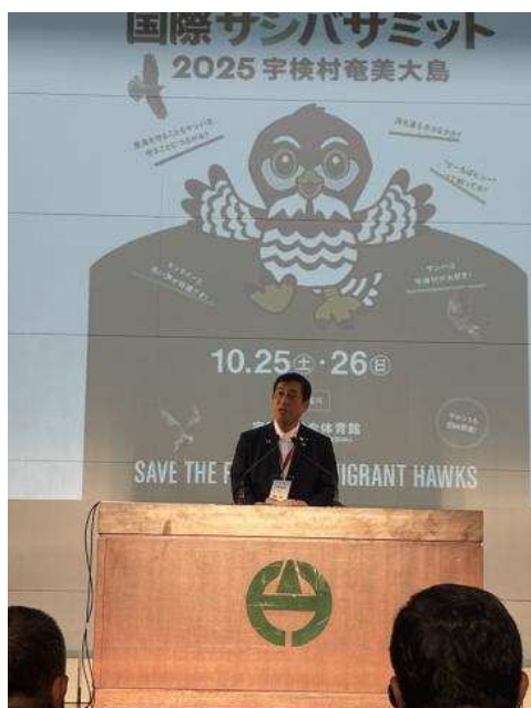
▲知事在峰会上致辞

希望通过此次峰会，在深化国内外保护雀鹰的合作同时，进一步推进对奄美大岛上珍惜动物的保护和生物多样性的维护。