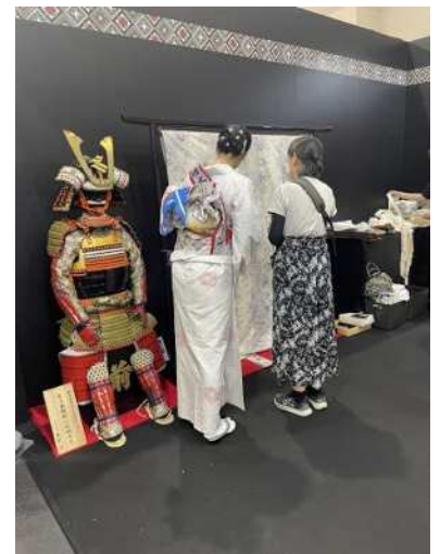
▲오시마츠무기에 대해 설명 중

재사우디아라비아 일본대사관을 예방하고 모리노 야스나리 대사, jetro 리야드 사무소와 사우디 아라비아의 경제상황과 일식의 진출 상황, 현산품 수출 가능성에 대해 의견교환을 하였습니다. 사우디아라비아는 젊은 층의 소비를 중심으로 건강을 생각하는 트렌드가 유행하고 있다는 의견이 있었습니다. 또한 일식은 고급요리라고 인식되어 있으며 와규와 말차에 대한 관심은 높지만 다른 국가 산(産)과 구별되지 않고 있는 상황에 대하여도 이야기 하였습니다. 엑스포와 월드컵의 개최가 예정으로 더 큰 경제성장이 기