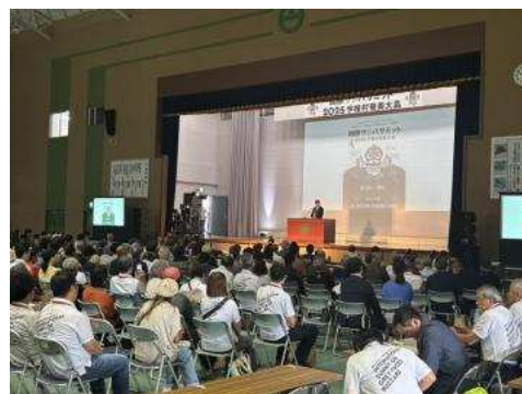
◀서밋 회장의 모습