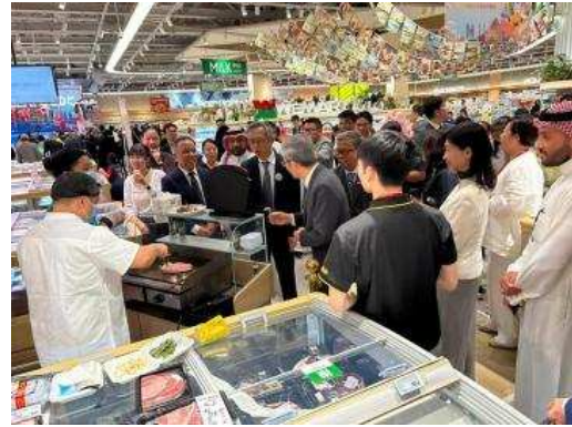
▲와규 라이브 퍼포먼스