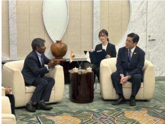
▲람쿠마르 총영사와 이야기하는 모습

관계 발전에 협력을 요청하였습니다. 또한 국토가 넓은 인도의 각 주의 특징에 대해 더욱 공부해보고 싶다고 이야기하였습니다.