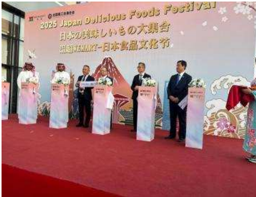
▲테이프 커팅의 모습

사우디아라비아 리야드의 대형슈퍼 <위마트>에서 개최된 전국상공회연합회 주최 「Japan Delicious Food Festival 2025」의 오프닝 세레모니에 출석하였습니다. 이 행사에는 위마트 총 사장, 모리노 야스나리대사, 모리 요시히사 전국상공회연합회 회장 등과 테이프 커팅을 한 후 만찬회에 참가하였습니다. 시오타지사는 가고시마현은 세계적으로 인기 있는 와규와 양식 방어, 차(茶)의 일본 최대 생산지라는 내용의 PR을 하였습니다. 이 행사에는 가고시마현의 와규와 화과자 등을 포함, 전국상공회연합회가 선정한 일본 각지의 상품을 출전하였으며 특히 가고시마현산 와규의 시식 부스에 많은 현지인이 줄을 서며 행사를 성황리에 마쳤습니다.