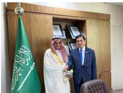
▲슬레이만 알-하티브 농업차관과

농립수산분야에 있어 일본과 관계 강화를 향한 사우디아라비아의 기대를 확인할 수 있는 방문이었습니다.