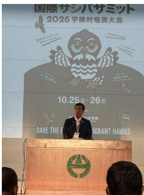
▲서밋에서 인사를 하는 모습

이 서밋을 통해 왕새매의 보전을 위해 국내외의 연계가 더욱 깊어지고 아마미 오시마의 희귀종 보호와 생물다양성의 보전이 한층 더 진행될 수 있기를 기대합니다.