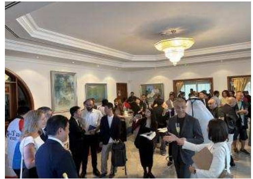
▲PR만찬회 회장의 모습