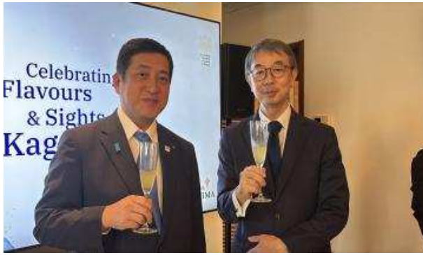
▲이마니시 준 재두바이 일본총영사와 기념촬영