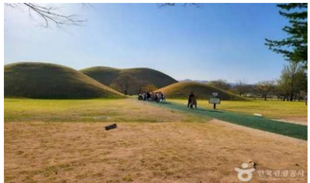
▲대릉원의 전경

경주 대릉원은 신라 왕조의 고분들이 모여 있는 역사적 장소로, 23 기의 다양한 규모의 고분이 모여있습니다. 가장 유명한 천마총은 금관과 다양한 유물이 출토되어 신라의 뛰어난 문화를 엿볼 수 있습니다. 이곳을 방문하면 신라 시대의 장대한 역사와 고대 장례문화를 직접 체험할 수 있습니다. 대릉원은 한국 고대사의 숨결을 느낄 수 있는 대표적인 명소입니다