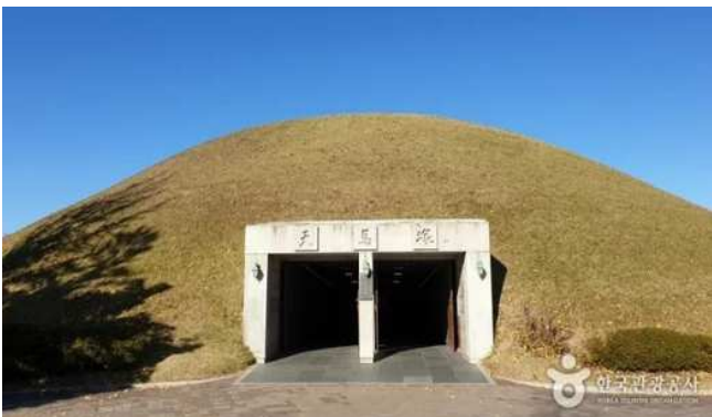
◀천마총 입구