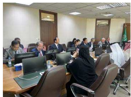
▲환경·수자원·농업성에서 의견교환을 하는 모습