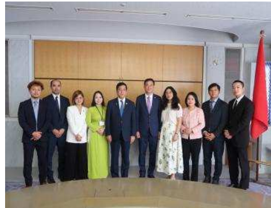
▲베트남 대사관 여러분들과 기념촬영