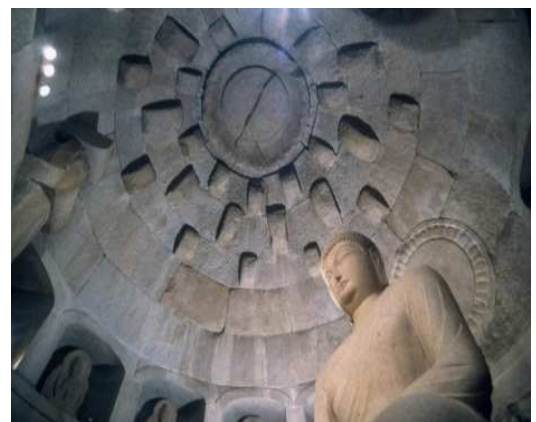
▶석굴암 본존

석굴암은 인공 동굴 안에 있는 불상과 조각들이 뛰어난 예술적 가치를 지닌 불교 유적지입니다. 두 곳 모두 신라 불교 문화의 정수를 보여주며, 한국 불교 역사의 중요한 유산으로 평가받고 있습니다. 평화롭고 경건한 분위기 속에서 고요함을 느낄 수 있는 장소입니다.