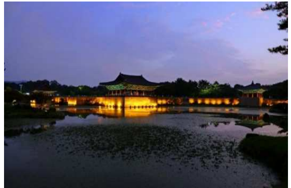
▲라이트업 된 동궁과 월지

동궁과 월지는 신라 왕족들의 별궁이었던 곳으로, 특히 밤에 조명이 켜진 월지 연못의 아름다움이 유명합니다. 연못 주위로 조성된 정원과 고풍스러운 건축물들은 신라 시대의 궁궐 문화를 잘 보여줍니다. 이곳은 옛 왕실의 사치와 평화로운 생활을 상상하게 하는 곳으로, 사계절 내내 아름다운 풍경을 자랑합니다. 역사와 자연이 어우러진 명소로 관광객들에게 사랑받고 있습니다.