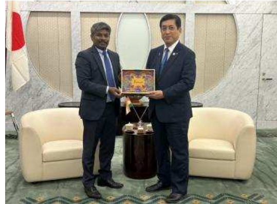
▲람쿠마르 총영사와 기념촬영