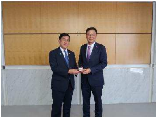
▲팜 쾡 히에우 주일 베트남대사와

시오타 지사는 지금까지 가고시마현과 베트남의 교류에 대한 지원에 대해 감사의 말을 전하며 앞으로도 양국, 지역간의 관계를 강화하고 싶다고 이야기 하였습니다.