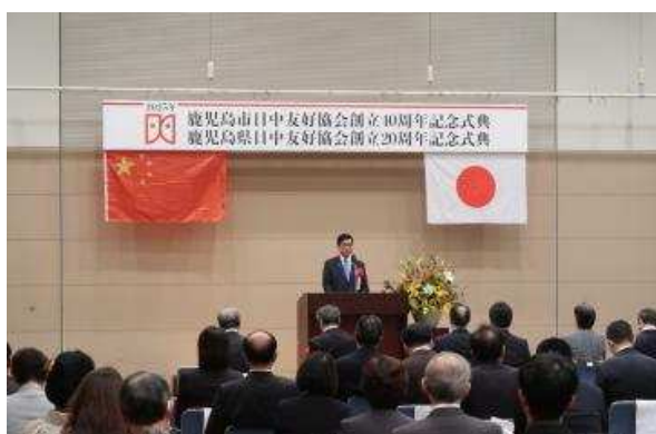
▲典礼中知事致辞的样子

希望以此为契机，两协会今后能够蓬勃发展，本县与中国的交流不断深化，友好关系持续发展。