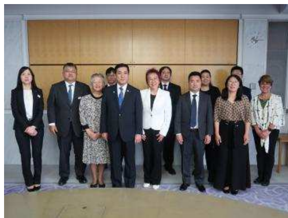
▲与巴西鹿儿岛县人会各位的纪念合影