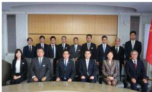
▲与驻日中国大使馆和驻福冈总领馆各位的纪念合影