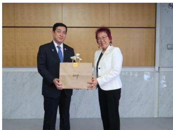
▲与上园前会长的纪念合影

希望今后在迄今为止建立的交流基础上，进一步深化与巴西鹿儿岛县人会的交流与合作关系。