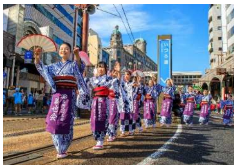
▲「夜祭」，「本祭」的样子