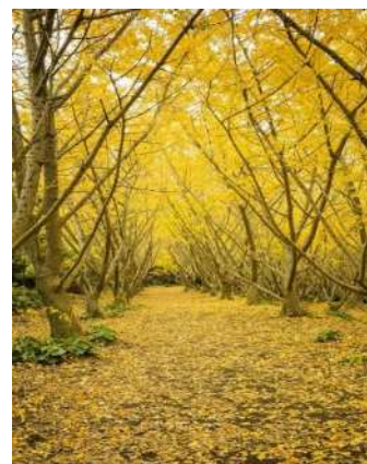
染成金黄色的银杏树林▶

垂水市的代表名胜银杏园中种植了1200多棵银杏树，每逢季节更替，整片区域都被染成了金黄色。园主与妻子携手共同开垦荒山，历经40多年打造了“黄金乐园”。在活动期间有夜间点灯活动，可以享受梦幻的氛围。