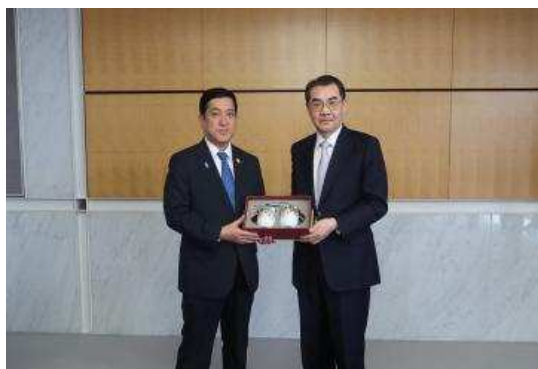
▲与吴江浩大使的纪念合影