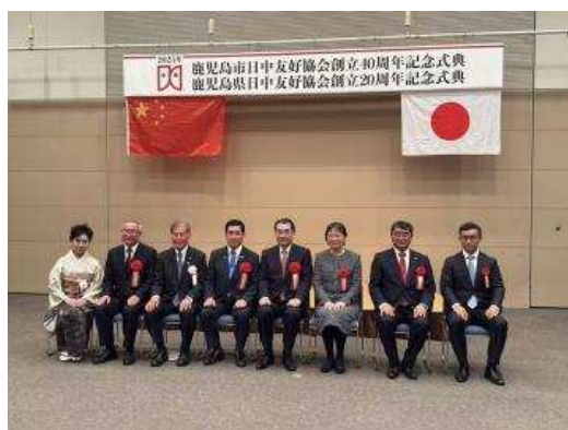
▲与各位的纪念合影